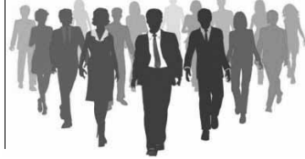
იხილეთ მე-3 გვ.