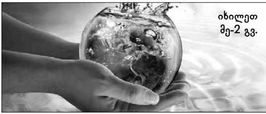
იხილეთ მე-2 გვ.