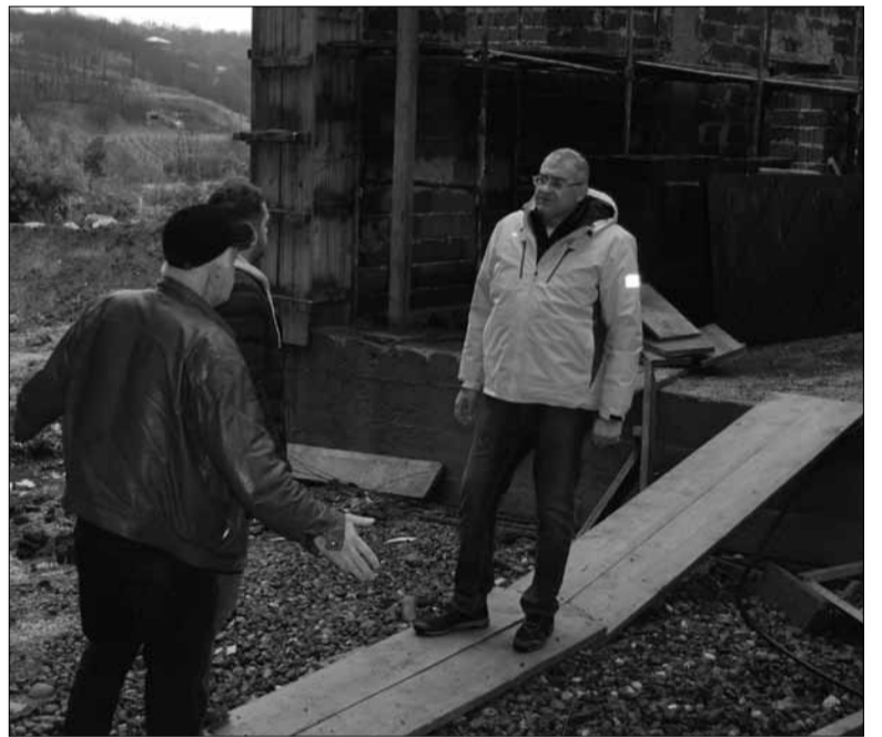
ერთად გაეცნო. ვალდებულების მიხედვით, მშენებლობა ორგანიზაცია

საზანოში საჭიდაო დარბაზის მშენებლობის სამუშაოები აქტიურად მიმდინარეობს. ახლახანს მშენებლობის ზესტაფონის მუნიციპალიტეტის მერი კახაბერ მახათაძე ესტუმრა და პროცესს ადგილზე გაეცნო. საჭიდაო კომპლექსის მშენებლობა მუნიციპალიტეტის დაკვეთით რამდენიმე თვის წინ დაიწყო სოფელში. პროექტი ადგილობრივი ბიუჯეტის დაფინანსებით ხორციელდება და მისი ღირებულება 157 207 ლარია. ახალი დარბაზის მშენებლობის დასრულების შემდეგ, აღსაზრდელებს შესაძლებლობა ექნებათ, როგორც თავისუფალი სტილით ჭიდაობაში, ასევე ძიულში ივარჯიშონ. როგორც კახაბერ მახათაძე აღნიშნა, საჭიდაო დარბაზის მშენებლობა დიდ როლს ითამაშებს ახალგაზრდებში ცხოვრების ჯანსაღი წესის დამკვიდრებაში. მშენებლობის პროცესს მუნიციპალიტეტის მერი სოფლის მაჟორიტარ დეპუტატთან, ბუბა ნასრაძესთან