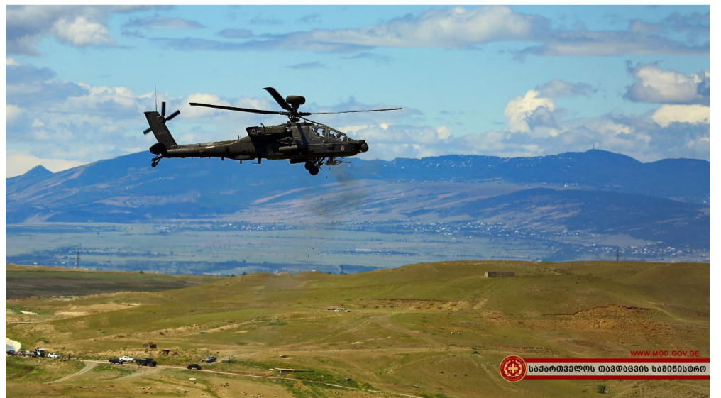
WWW.MOD.GOV.GE საპარტნიორო თავდაცვის სამინისტრო