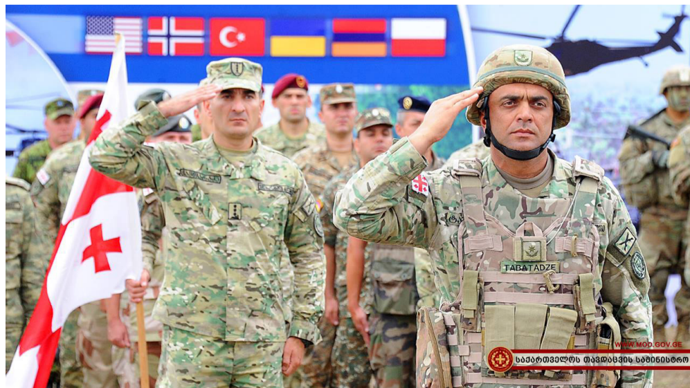
WWW.MOD.GOV.GE საპარტნიორო თავდაცვის სამინისტრო