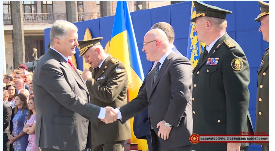
საპარტოვალს თავდაცვის მინისტრი

„საერთო გამოწვევების წინაშე ვდგავართ, გვაქვს საერთო ამოცანები, ჩვენს მეგობრობას, სტრატეგიულ კავშირებს გადამწყვეტი მნიშვნელობა აქვს. უკრაინელ ხალხს სტრატეგიული ამოცანების წარმატებით განხორციელებას ვუსურვებ“, - ამ სიტყვებით მიულოცა საქართველოს თავდაცვის მინისტრმა უკრაინელ ხალხს დამოუკიდებლობის დღე.