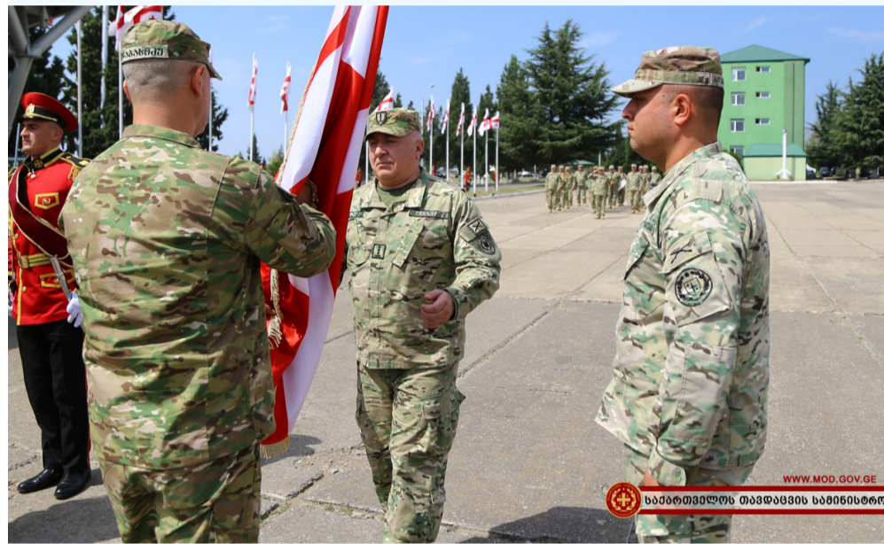
საპარტოვალს თავდაცვის მინისტრი

საქართველოს თავდაცვის მინისტრმა ლევან იზორიამ შეკრებილ პირად შემადგენლობას სიტყვით მიმართა და ქართველი სამხედრო მოსამსახურეების პროფესიონალიზმზე გაამახვილა ყურადღება. უწყების ხელმძღვანელი სამხრეთ კავკასიასა და ცენტრალურ აზიაში ნატოს გენერალური მდივნის სპეციალური წარმომადგენლის ჯემს აპატურაის მიერ ქართველი სამხედრო მოსამსახურეების შესახებ გაკეთებულ შეფასებას გამოეხმაურა, სადაც ის აცხადებს, რომ დღეს საქართველოს შეიარაღებული ძალები გაცილებით გამოცდილი, კარგად გაწვრთნილი, კარგად აღჭურვილი და უფრო თავისებურია, ვიდრე 10 წლის წინ.