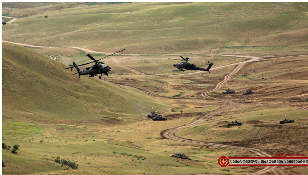
WWW.MOD.GOV.GE საპარტნიორო თავდაცვის სამინისტრო

პირველ აგვისტოს ჟურნალისტები ვაზიანის სამხედრო აეროდრომის შესასვლელთან დაგვარტივეთ. აუცილებელი აკრედიტაციის გავლის შემდეგ კი ვველა ერთად ასაფრენ ბილიკზე მოწყობილ სპეციალურ ადგილზე მივვლით. 13 ქვეყნის სამხედროებს შორის ქართველი მეგობრები