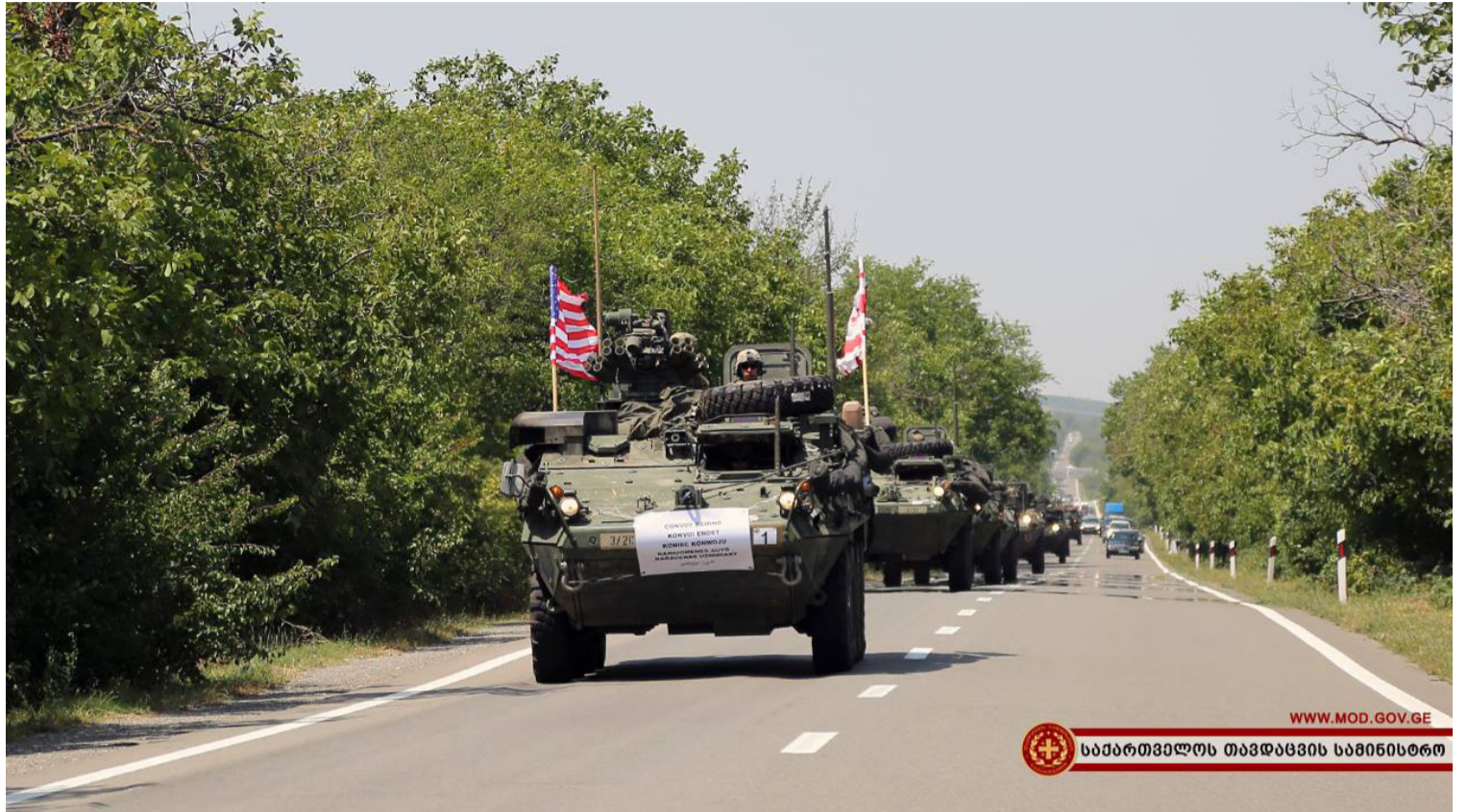
WWW.MOD.GOV.GE საპარტნიორო თავდაცვის სამინისტრო

„ღირსეული პარტნიორი 2018-ის“ დაწყება თავდაცვის მინისტრმა ლევან იზორიამ საქართველოს მოსახლეობას საინფორმაციო ბრიფინგით აუწყა. ამიტომ თითქმის არავისთვის მოულოდნელი არ იყო როდესაც ამერიკულმა საბრძოლო ჯავშანმანქანებმა „სტრაიკერებმა“ ფოთიდან თბილისისკენ მარშით გადაადგილება დაიწყეს. რუსეთ-საქართველოს ომიდან 10 წლის შემდეგ ომის დროს დაბომბულ ქალაქში ამერიკელმა სამხედროებმა მეგობრობის ნიშნად მოსახლეობასთან შეხვედრაც გადაწყვიტეს. გორის მოსახლეობაც მოკავშირეების შემოსვლას საგანგებოდ მომზადებული დახვდა. ეს იყო პირველი ნიშანი იმისა, რომ მალე ვაზიანში, ნორითში და მუხროვანში უპრეცედენტოდ დიდი სამხედრო სწავლება დაიწყებოდა. თუმცა, სანამ სწავლების მიმდინარეობის მნიშვნელოვან დეტალებს შეიტყობთ, გაგაცნობთ რას წარმოადგენს „ღირსეული პარტნიორი 2018“.