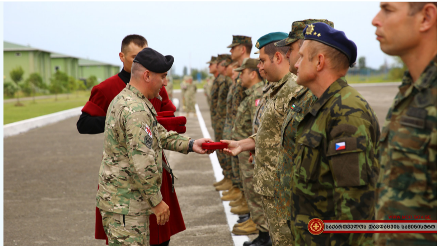
საპარტოვალს თავდაცვის მინისტრი

სწავლების დასრულის ცერემონიალი საქართველოს სახელმწიფო ჰიმნის შესრულებით დაიწყო, რის შემდეგაც საბრძოლო მოქმედებებში და სამსახურებრივი მოვალეობის შესრულებისას დაღუპულ სამხედრო მოსამსახურეთა ხსოვნას წუთიერი დუმილით პატივი მიაგეს.