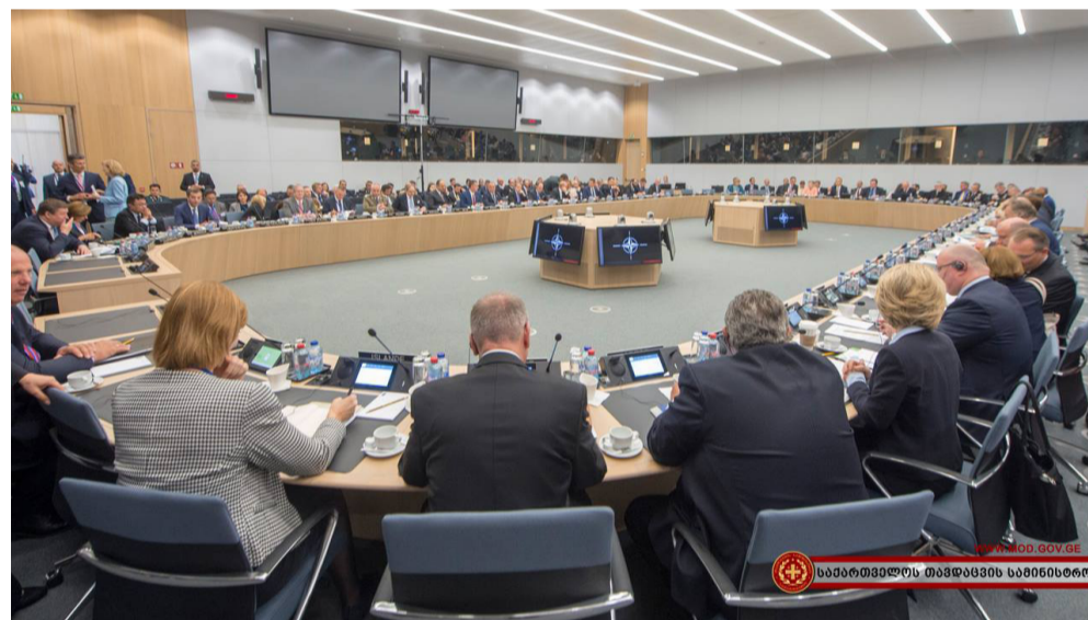
საპარტამენტოს თავდაცვის სამინისტრო

ინსტიტუტების მოდერნიზების კუთხით. ეს ეხება კანონის უზენაესობას და იმასაც, რომ საქართველო