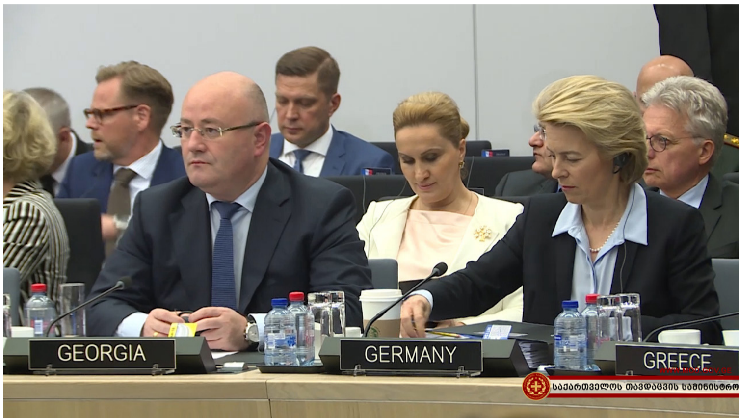
საპარტამენტოს თავდაცვის სამინისტრო

7-8 ივნისს ბრიუსელში ნატოს თავდაცვის მინისტრიალს უმასპინძლა. მინისტრიალში მონაწილეობის მიზნით, ბელგიის სამეფოში საქართველოს თავდაცვის სამინისტროს დელეგაცია, თავდაცვის მინისტრის, ლევან იზორიას ხელმძღვანელობით იმყოფებოდა. საქართველოს თავდაცვის მინისტრმა „მტკიცე მხარდაჭერის“ მისიის (RSM) ფორმატში ნატოსა და პარტნიორი ქვეყნების თავდაცვის მინისტრების შეხვედრაში მიიღო მონაწილეობა. სხდომა ნატოს გენერალურმა მდივანმა იენს სტოლტენბერგმა გახსნა და აღნიშნა, რომ ავღანეთისთვის ნატოსა და პარტნიორი ქვეყნების მხარდაჭერა სასიცოცხლოდ მნიშვნელოვანია: „ვზრდით კონტინგენტს ჩვენ საწვრთნელ მისიაში და ვაგრძელებთ ავღანეთის ძალებისთვის ფინანსურ უზრუნველყოფას, რათა მათ საკუთარი ძალებით შეძლონ ქვეყანაში უსაფრთხოების შენარჩუნება“.