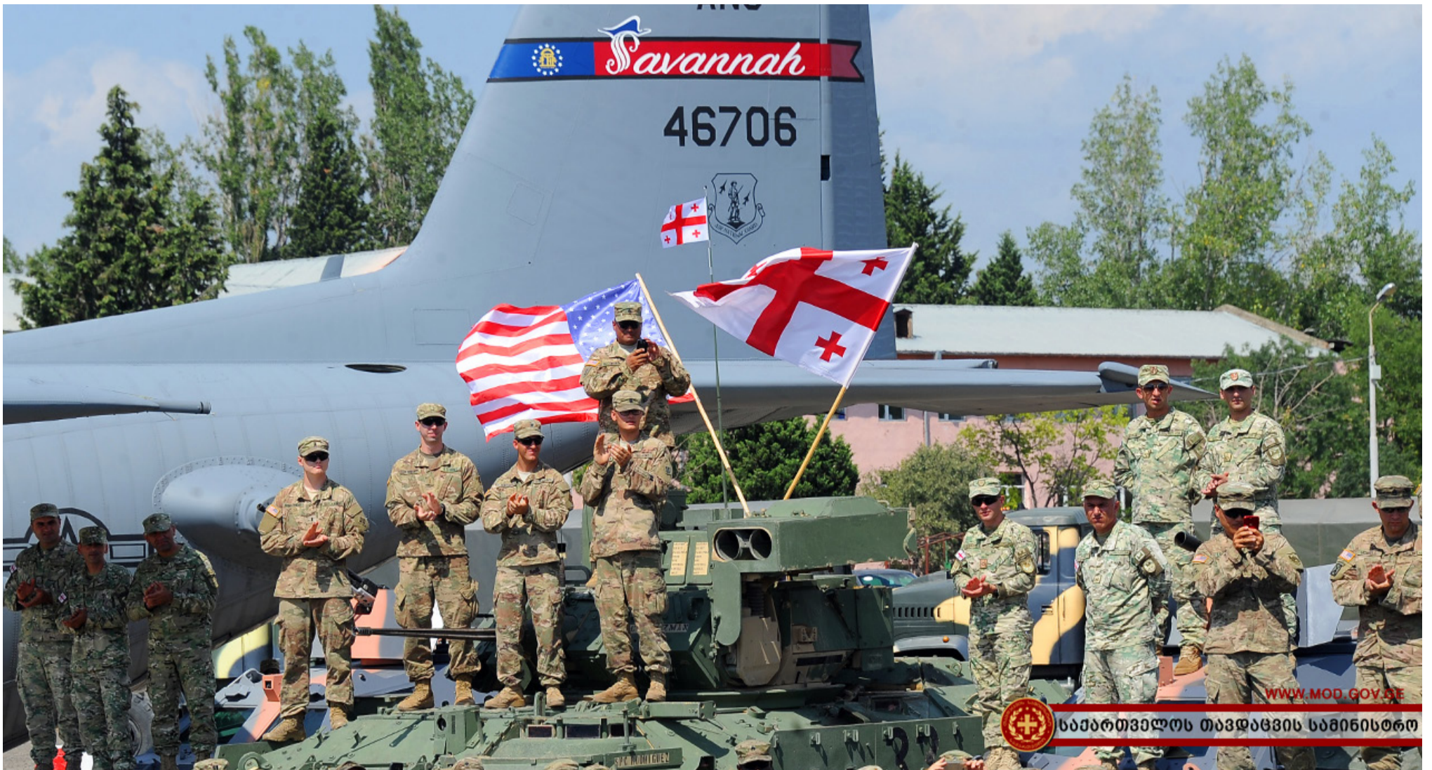
საპარტოვლოს თავდაცვის სამინისტრო

უფრო გაძლიერდეს. ეს ყველაფერი კი, სწორედ, ქმედითი და ძლიერი შეკავების პოლიტიკის განხორციელების მიზნით კეთდება. პროგრამას, რომელსაც ვიწვევთ, სიმბოლურად „საქართველოს თავდაცვის მზადყოფნის“ პროგრამა ჰქვია. მზადყოფნაც შეკავების პოლიტიკის ერთ-ერთი მნიშვნელოვანი ელემენტია.