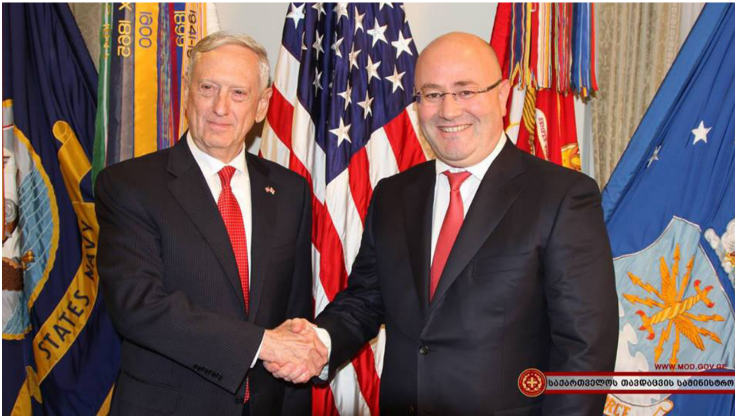
საპარტოვალს თავდაცვის სამინისტრო

- ბატონო მინისტრო, საქართველოს შეიარაღებული ძალები არსებობს 27 წელს ითვლის. რამდენად წარმატებული იყო ამ პერიოდში შეიარაღებული ძალების ტრანსფორმაცია და შეგვიძლია თუ არა თამამად განვაცხადოთ, რომ საქართველოს უკვე ჰყავს თანამედროვე, ნატოს სტანდარტების შეიარაღებული ძალები, რომელსაც შეუძლია დაკისრებულ ამოცანებს წარმატებით გაართვას თავი?