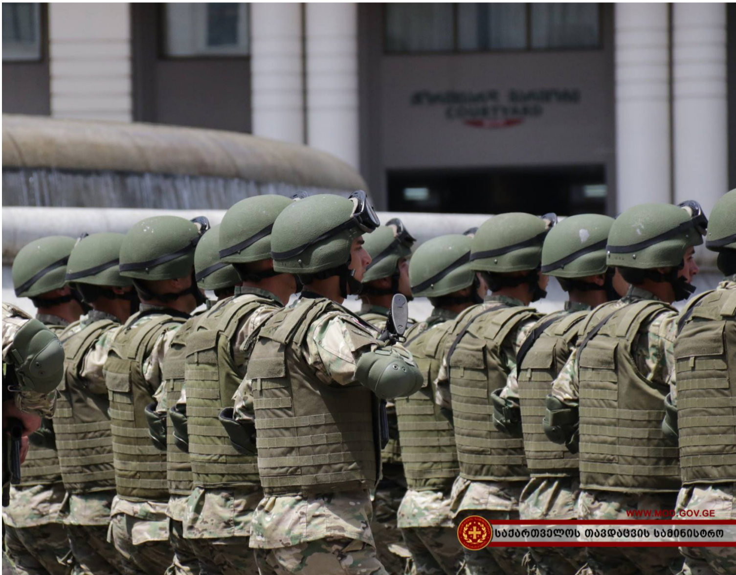
WWW.MOD.GOV.GE საქართველოს თავდაცვის სამინისტრო

საქართველოს შეიარაღებული ძალები მთლიანად ქართული ჯავშანთილაგებითა და ჩაფხუბებით აღიჭურვა