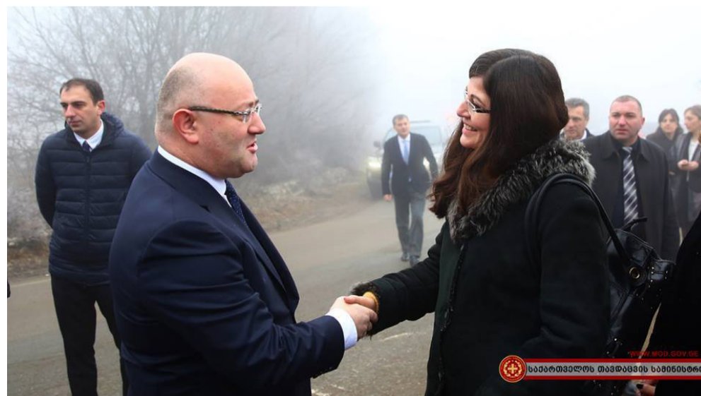
საქართველოს თავდაცვის სამინისტრო