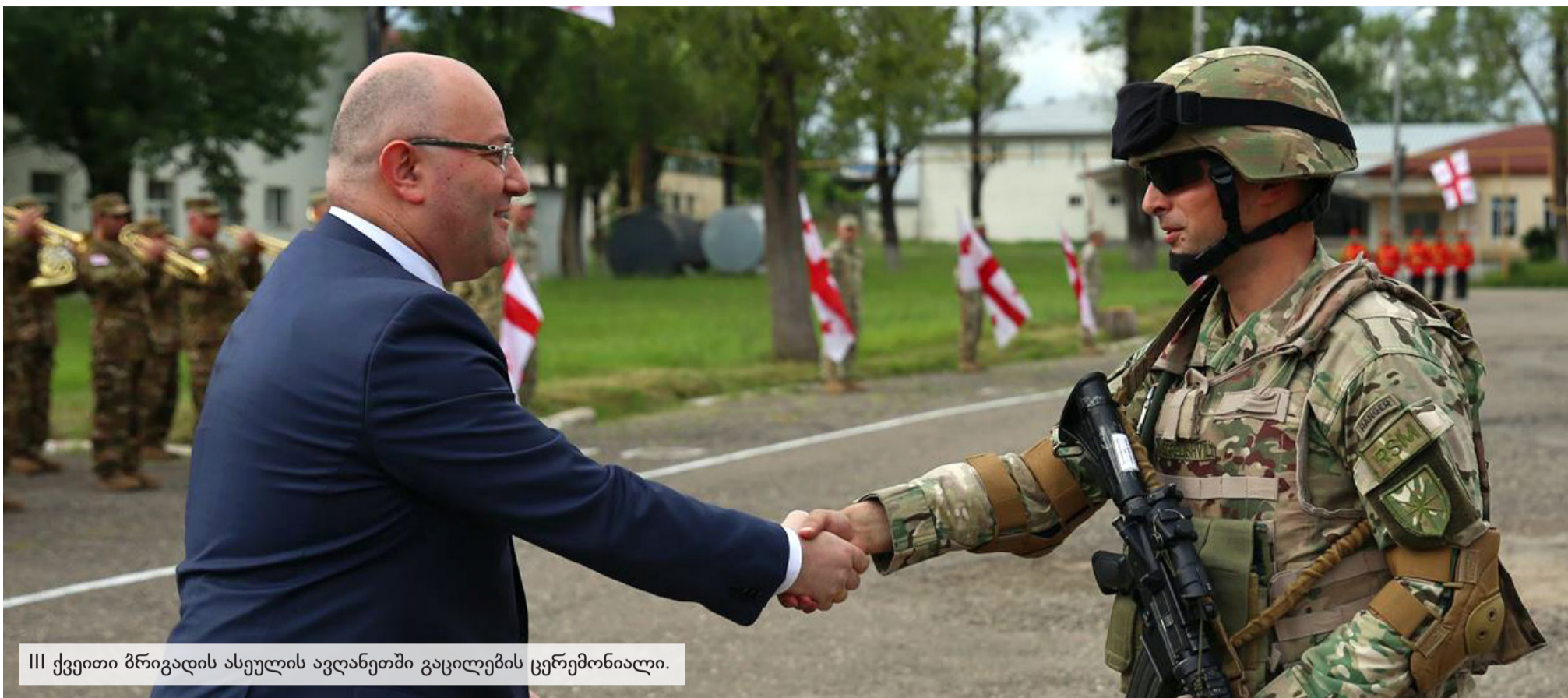
III ქვეითი ბრიგადის ასეულის ავღანეთში გაცილების ცერემონიალი.