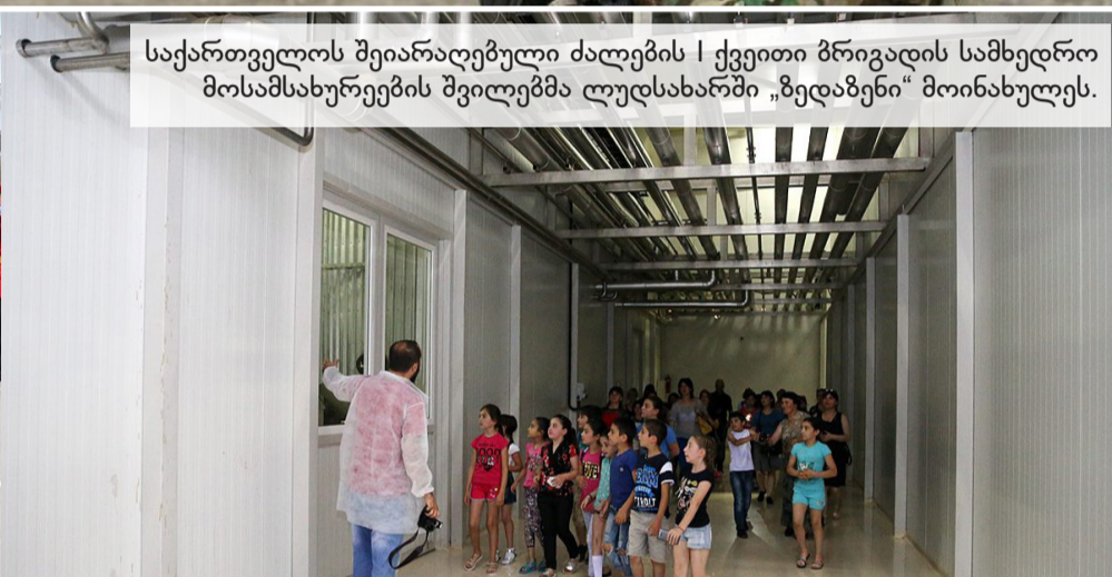
საქართველოს შეიარაღებული ძალების | ქვეითი ბრიგადის სამხედრო მოსამსახურეების შვილებმა ლუდსახარში „გედაგენი“ მოინახულეს.