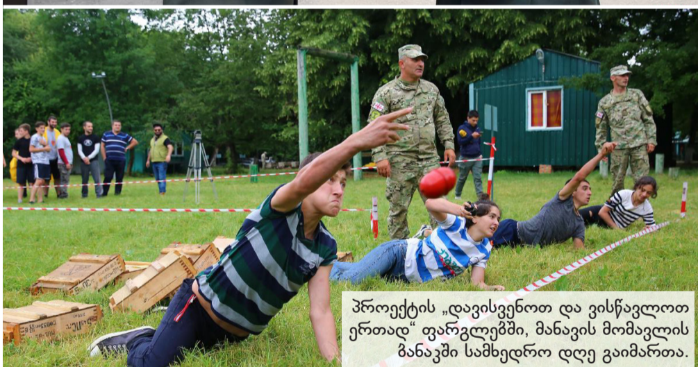
პროექტის „დავისვენოთ და ვისწავლოთ ერთად“ ფარგლებში, მანავის მომავლის ბანაკში სამხედრო დღე გაიმართა.