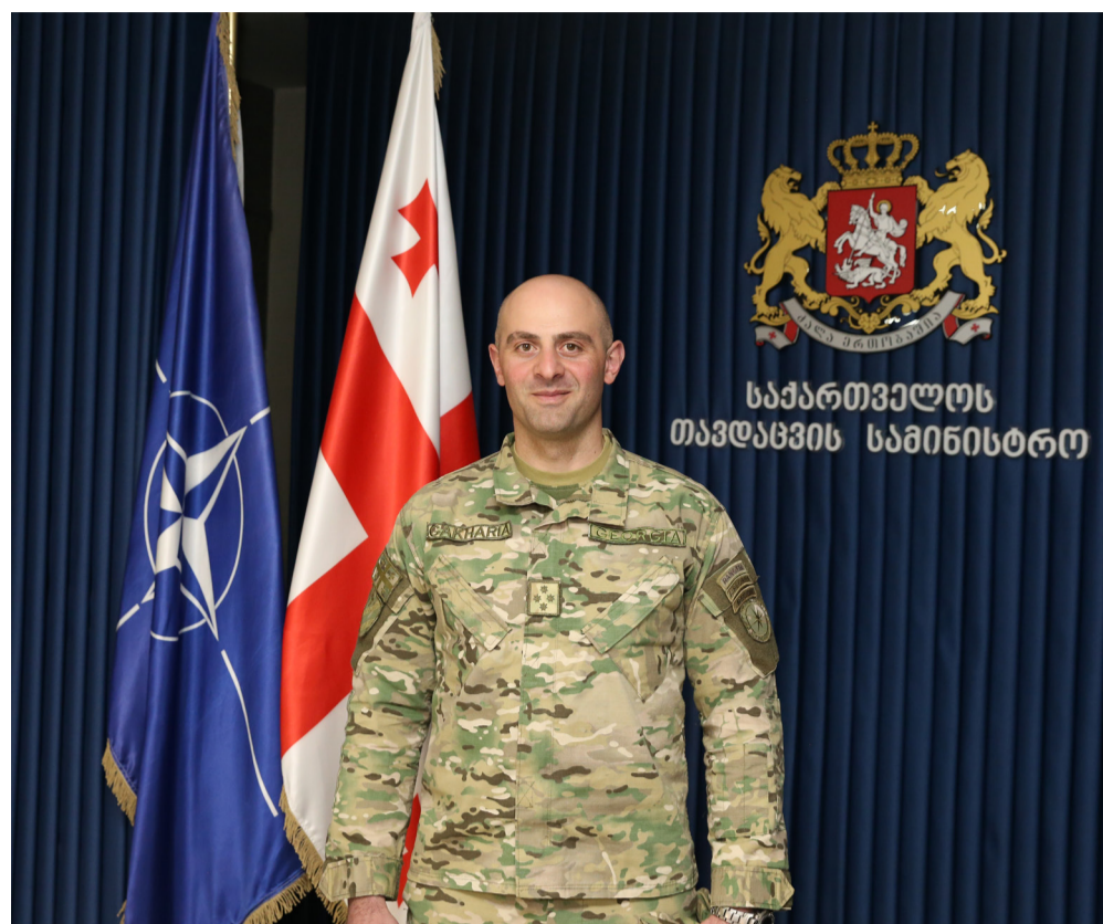
საქართველოს თავდაცვის სამინისტრო

საქართველოს თავდაცვის უნარიანობის გაძლიერებითა და შეიარაღებული ძალების წარმატებული ტრანსფორმაციით, საერთაშორისო პარტნიორობთან ურთიერთობების გაღრმავებითა და ქვეყნის თავდაცვისა და უსაფრთხოების საქმეში ყველა მოქალაქის ჩართულობით, ჩვენ შეგძლებოდა გაუმკლავდეთ არსებულ გამოწვევებს და გავხდეთ ჩრდილო-ატლანტიკური ალიანსის ღირსეული წევრი.