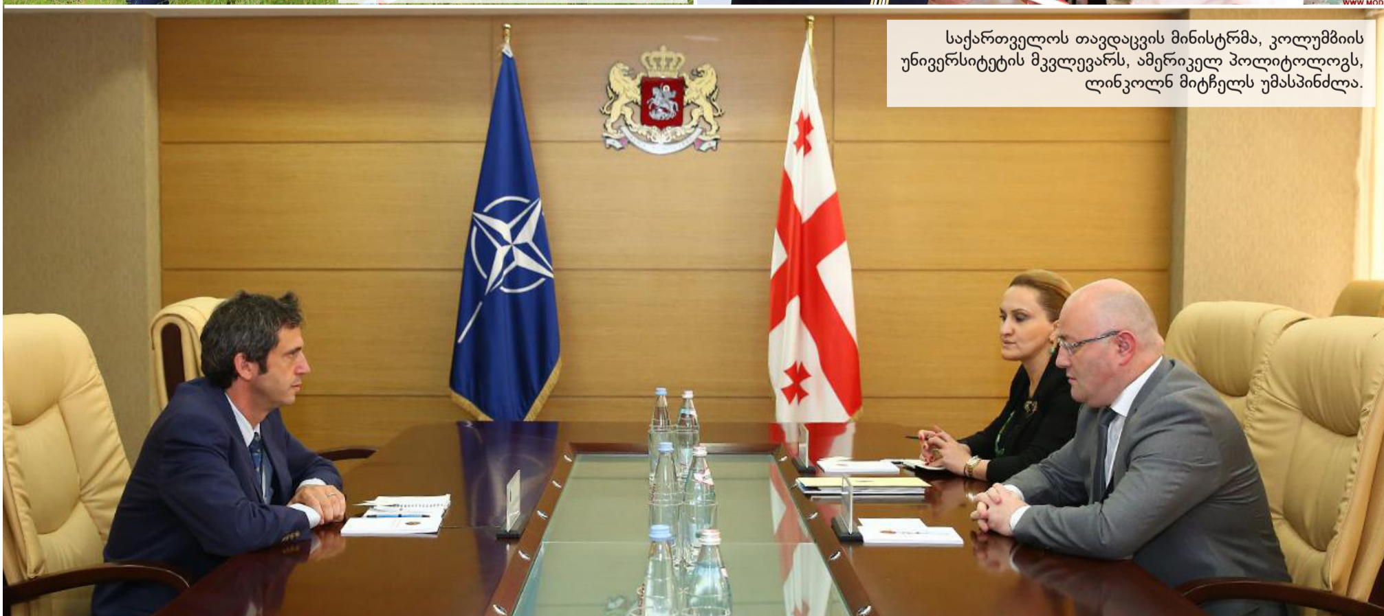
საქართველოს თავდაცვის მინისტრმა, კოლუმბიის უნივერსიტეტის მკვლევარს, ამერიკელ პოლიტოლოგს, ლინკოლნ მიტჩელს უმასპინძლა.