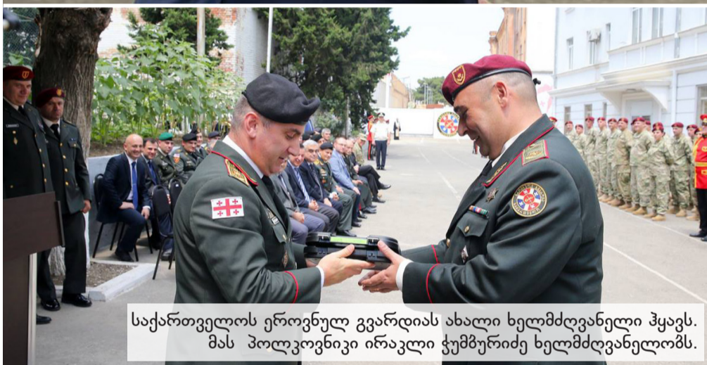
საქართველოს ეროვნულ გვარდიას ახალი ხელმძღვანელი ჰყავს. მას პოლკოვნიკი ირაკლი ჭუმბურიძე ხელმძღვანელობს.