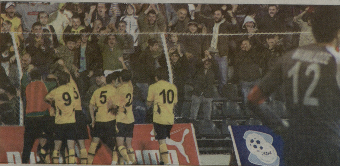
ქუთაისელთა სიხარული ზესტაფონში