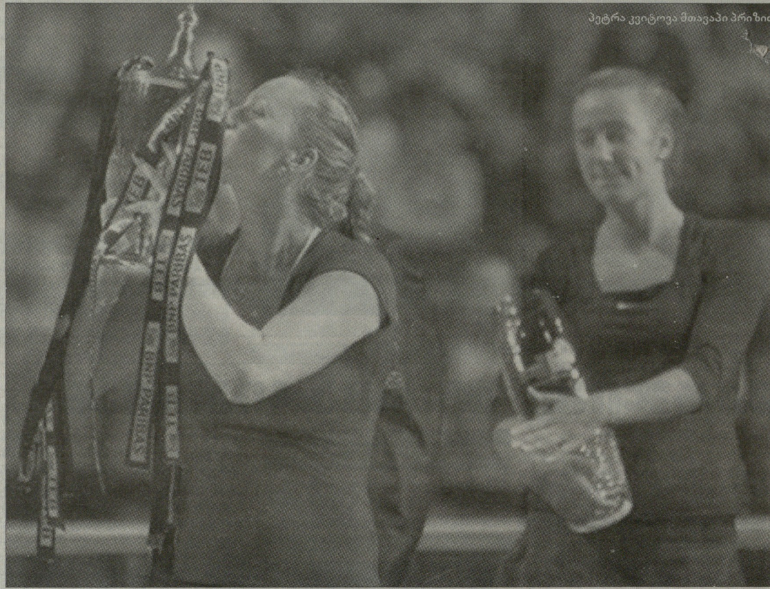
პეტრა კვიტოვა მთავარი პრიზით