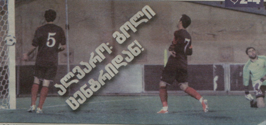
დინამო-სპარტაკი 2:0. გოლი სპარტაკის კარში