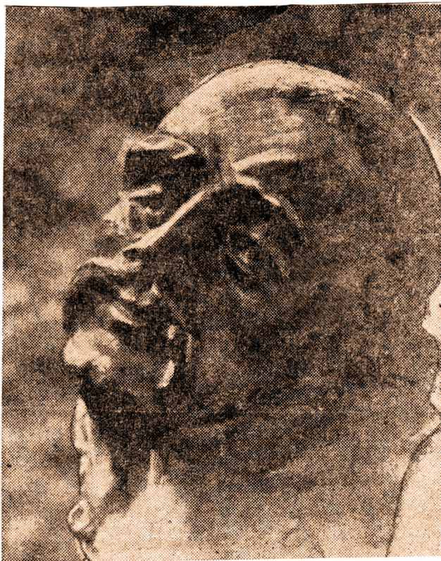
ლადო კოტეტიშვილი – ვაჟა-ფშაველას პორტრეტული ქანდაკება, რომელიც ინახება ლიტ. მუზეუმში..