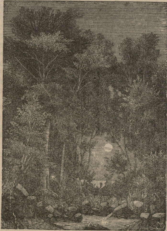
სადამო ტეეში ხეზე ამოჭრილი გ. ტატიშვილისაგან.