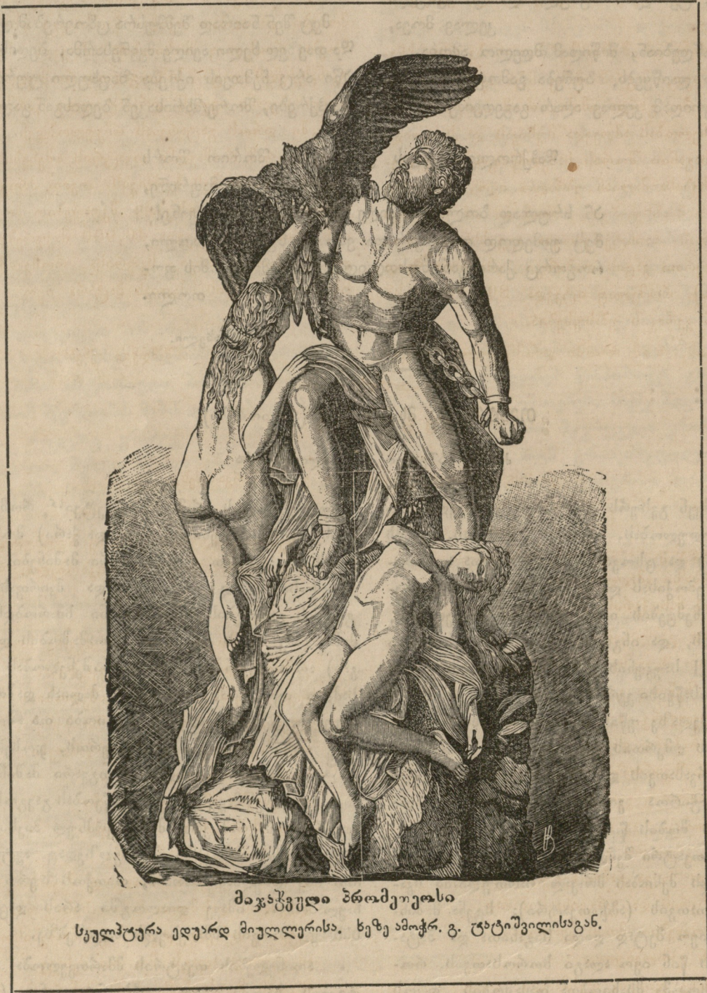
მაკატვეული პრამეუოელი სკულპტურა ედუარდ მიულლერისა. ხეზე ამოჭრ. გ. ცატოშვილისაგან.

რომელსაჲე გამოჩენილ და კარგად ცნობილ პირებს მასკები იმ გვარად კეთდებოდა, რომ გასაცნობ მსკავსებს წარმადგენდენ სცენაზე გამოყენილ პირთან და