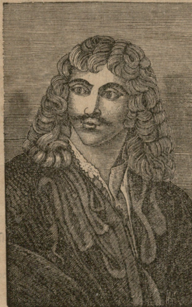
მულიერი (დრამატული მწერალი)

ჩვენი ლიტერატურა ვიღაცამ სათუო, უსურსერ ბაღს შეადარა, რომლის აღზრდა დიდდამ უდიდეს შრომას თხოულობს. არც უსაფუძვლოა ეს შედარება. ის მანც მართალია, რომ ჩვენი ლიტერატურის გაღვივებას ჩვენგან შეუძლებელი და თითქმის შეუძლებელი შრომა სჭირდება. სიტყვა „ლიტერატურის“ სმარება, მის მიუსუდეკლად გვაჩქეს ლიტერატურა თუ არა, სმარია ჩვენს მწერლობაში. ლიტერატურა შეიცავს მთელს და ყოველ გვარს მწერლობას ცნობილი ხალხისას. მასი წრე ფართოა. ეს წრე შესდგება: ბელეტრისტიკიადამ (პოეტისა ნაწარმოებადამ). ამის გარდა ლიტერატურას შეადგენს სხვა და სხვა მეცნიერებები მკვლევარნი: ფილოსოფიური მეცნიერება, ისტორიული, ფსიქოლოგიური, ფიზიკური, ქიმიური, ეტიკური და სხ. ჩვენს მწერლობაში