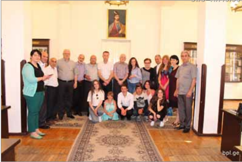
შეხვედრა ნინოწმინდის მუნიციპალიტეტში აჭარიდან ჩასახლებულ ეკომიგრანტ ბავშვებთან