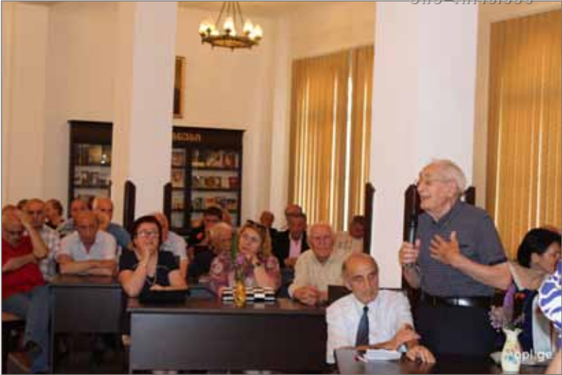
შეხვედრა ბათუმის კოლორიტებთან