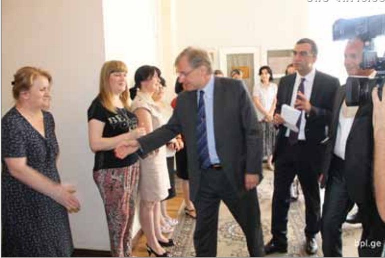
აშშ ელჩი საქართველოში რიჩარდ ნორლანდი 2014 წელი