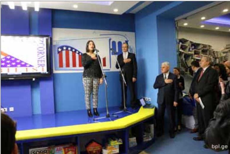
აშშ ელჩი საქართველოში იან კელი 2016 წელი