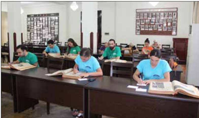
ბათუმისა და თბილისის უნივერსიტეტების სტუდენტები საზაფხულო დასაქმების პროგრამით ბათუმის საჯარო ბიბლიოთეკაში

2016 წლის აგვისტოში, მერიის პროგრამით გათვალისწინებული „საზაფხულო დასაქმების“ ფარგლებში მხვდა წილად პრაქტიკა გამეგლო ბათუმის აკაკი წერეთლის სახელობის საჯარო ბიბლიოთეკაში. ვარ ბათუმის შოთა რუსთაველის სახელობის სახელმწიფო უნივერსიტეტის ჰუმანიტარულ მეცნიერებათა ფაკულტეტის ქართული ფილოლოგიის სტუდენტი... ბედნიერი ვარ, რომ გავეცანი ბიბლიოთეკის შიდა სამზარეულოს... აქამდეც ნაწილობრივ ვიცოდი, მაგრამ ახლა უფრო უკეთ მივხვდი რამხელა შრომა სჭირდება შეინარჩუნო ის, რასაც აკეთებს აქაური კოლექტივი... განსაკუთრებით მინდა აღვნიშნო დამოკიდებულება კოლექტივისა მკითხველისადმი, რაც ჩემში იწვევს აღფრთოვანებას... ნებისმიერი ასაკის მკითხველს ეგებებიან ღიმილით და მაქსიმალურად ცდილობენ აქ შემოსული მკითხველი ნასიამოვნები გავიდეს. სუფევს