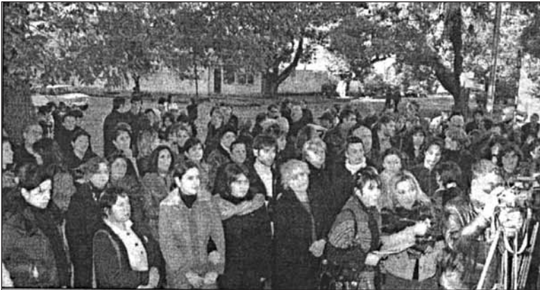
ბიბლიოთეკის თანამშრომლები საპროტესტო აქციაზე. 2006 წ.

აჭარის მთავრობის თავმჯდომარემ გაითვალისწინა სახელმწიფო ინტერესი და მხარი დაუჭირა საზოგადოების თხოვნას. ბიბლიოთეკა დარჩა თავის ადგილზე როგორც დამოუკიდებელი ერთეული და ასევე ისიც, რომ იმ