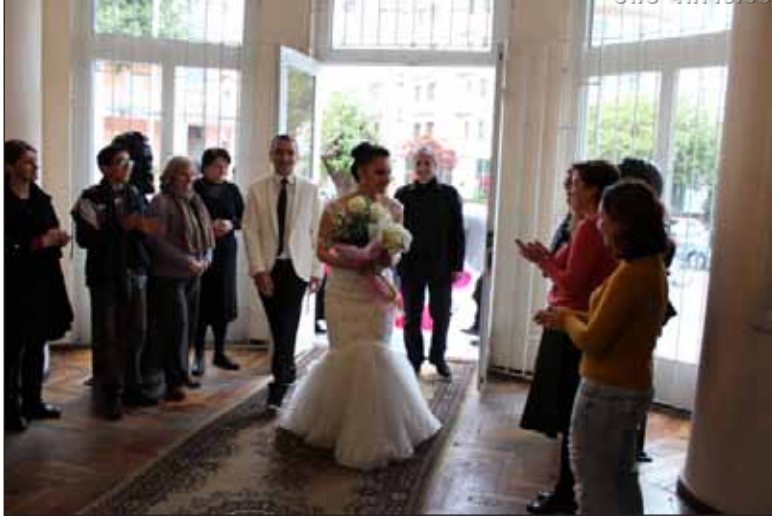
ბიბლიოთეკის მკითხველთა ქორწილი

არაერთი იუბილე გადაუხადა ბიბლიოთეკამ დღემდე მოქმედ პოეტებსა და მწერლებს.