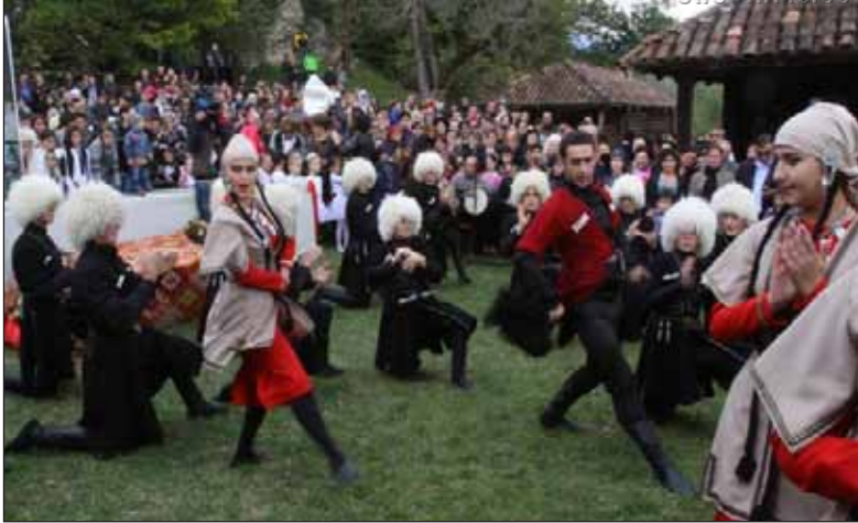
სოფელი სხვიტორი აკაკიოზის დღესასწაული აკაკის სახლმუზეუმის ეზოში