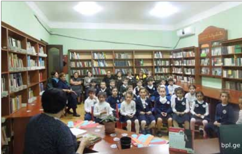
იაკობ გოგებაშვილის დაბადებიდან 175 წლისადმი მიძღვნილი საღამო (საბავშვო-ახალგაზრდობის განყოფილება)