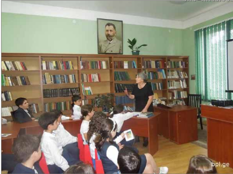
ღონისძიება საბავშვო –ახალგაზრდობის განყოფილებაში