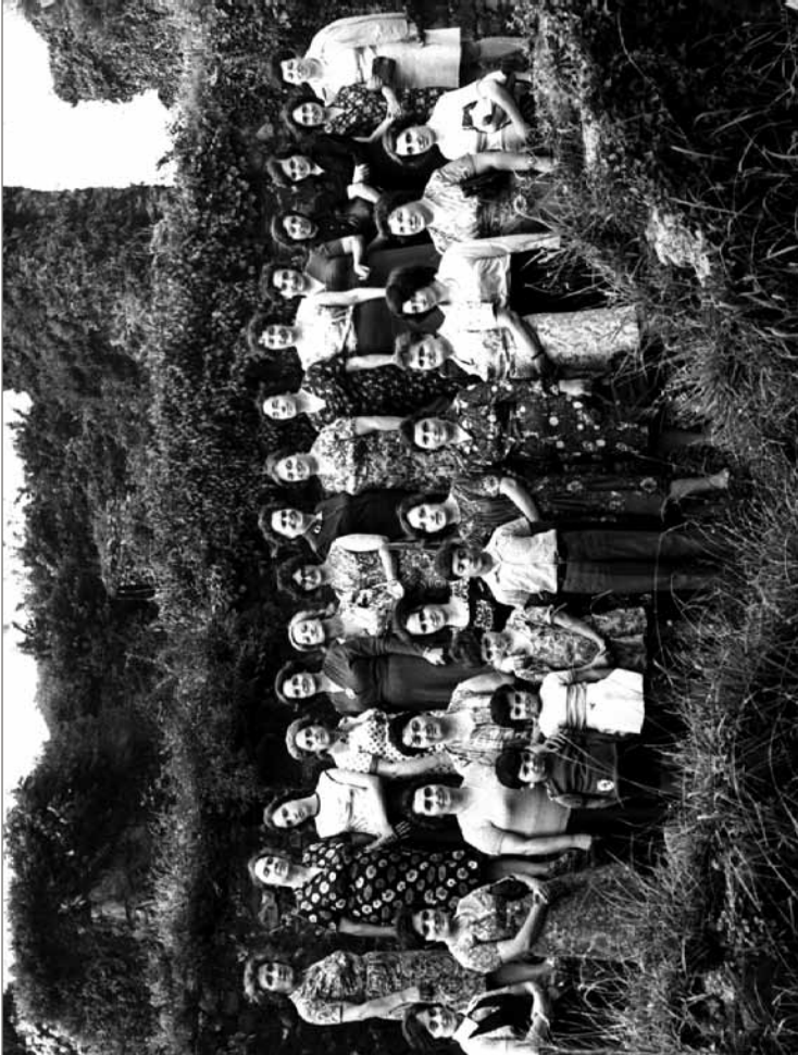
ქალაქ ბათუმის ბიბლიოთეკარები ექსკურსიაზე