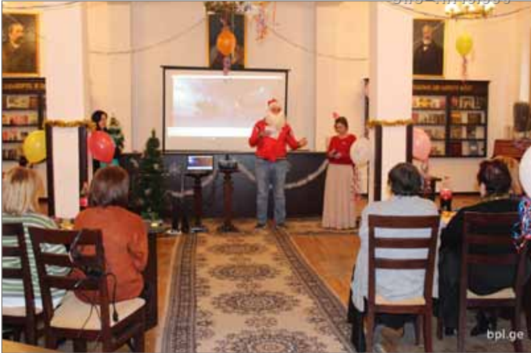
საახალწლო ზეიმი ბიბლიოთეკის თანამშრომლებთან