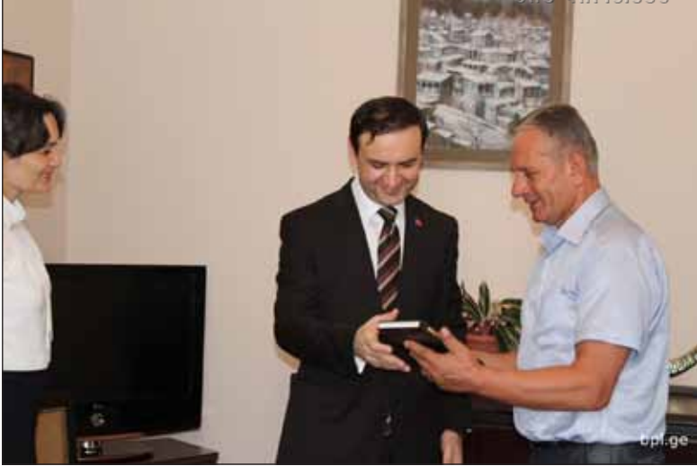
თურქეთის რესპუბლიკის გენერალური კონსული იასონ თემიზჯანი