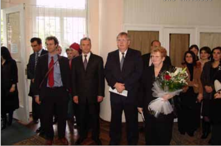
აშშ ელჩი ჯონ ტევტი 2006 წელი