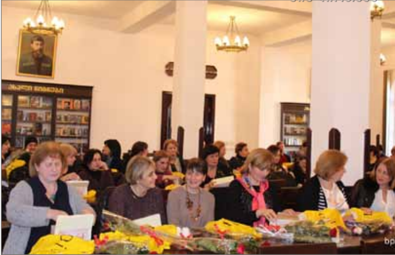
დედისა და ქალთა საერთაშორისო დღე