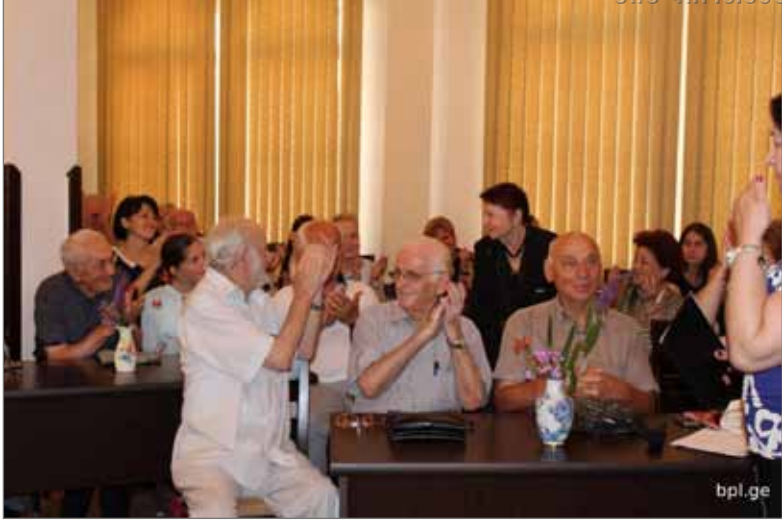
შეხვედრა ბათუმის კოლორიტებთან