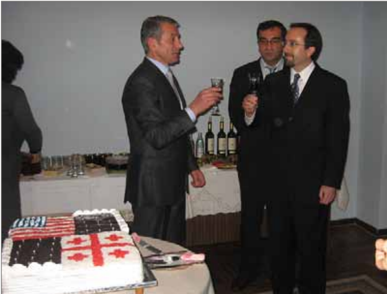
აშშ ელჩი საქართველოში ჯონ ბასი 2009 წელი