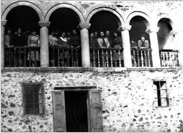
აკ. წერეთლის ბიბლიოთეკის თანამშრომლები ექსკურსიაზე სოფ. სხვიტორში აკაკი წერეთლის მამის - როსტომის სასახლეში მეოცე საუკუნის მიჯნაზე...