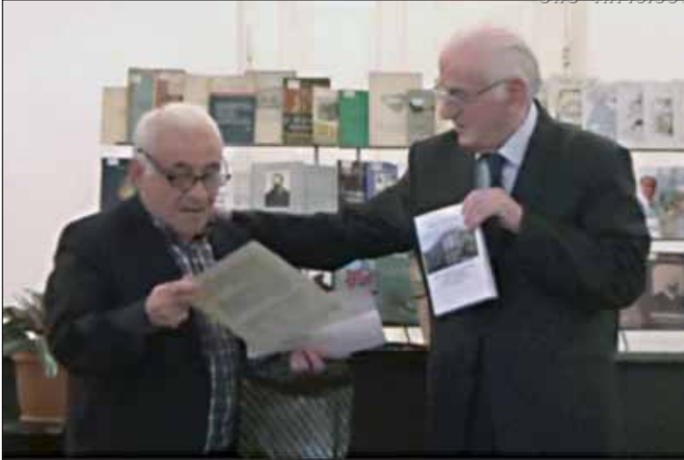
წიგნის „აკაკი წერეთლის სახელობის ქალაქ ბათუმის საჯარო ბიბლიოთეკა 115 წლისაა“ გადაცემა

9 მაისს დავასრულე წიგნი „აკაკი წერეთლის სახელობის ქალაქ ბათუმის საჯარო ბიბლიოთეკა 115 წლისაა“, ამოვბეჭდე საკონტროლო ეკზემპლარი, რათა ბატონ რამაზისთვის, როგორც რედაქტორისთვის გადამეცა.