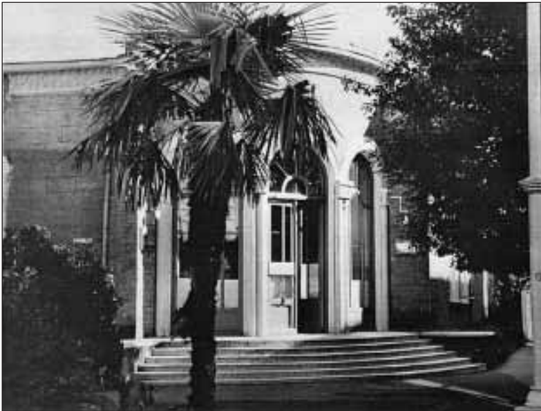
ბიბლიოთეკის ძველი ერთსართულიანის შენობა