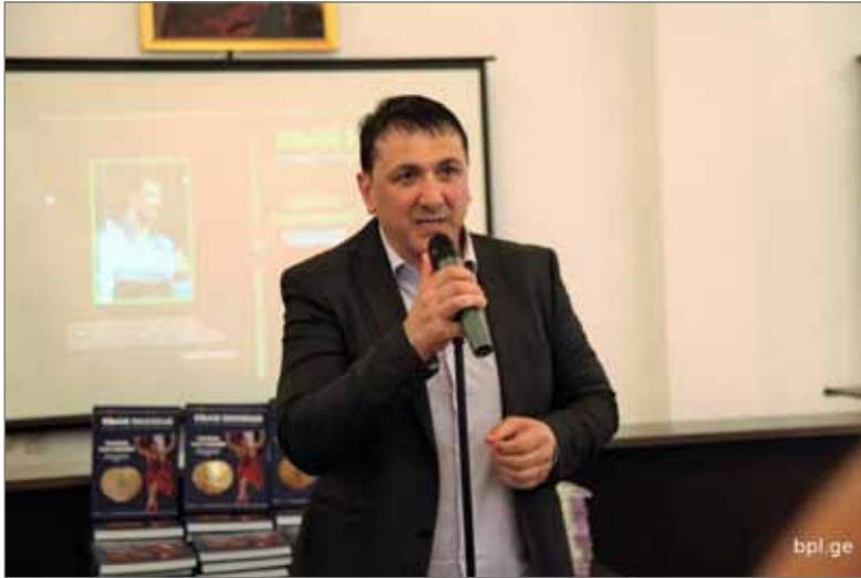
დამოუკიდებელი საქართველოს პირველი მსოფლიო ჩემპიონი ჭიდაობაში მუხრან ვახტანგაძე უმადლესი რანგის პოლიტიკოსებთან ერთად