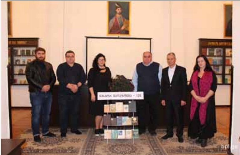
ნესტორ მაღაზონიას დაბადებიდან 125 წლისადმი მიძღვნილი საღამო