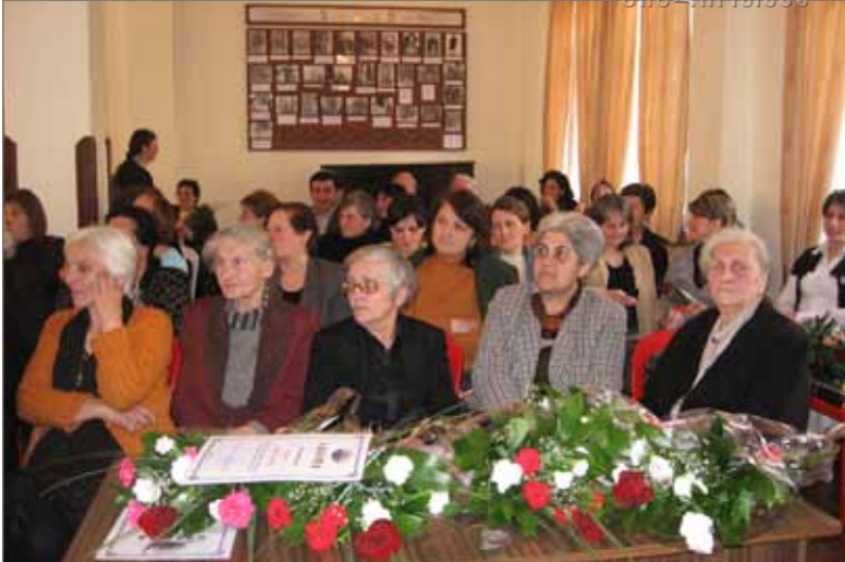
საქართველოს ბიბლიოთეკარის დღე