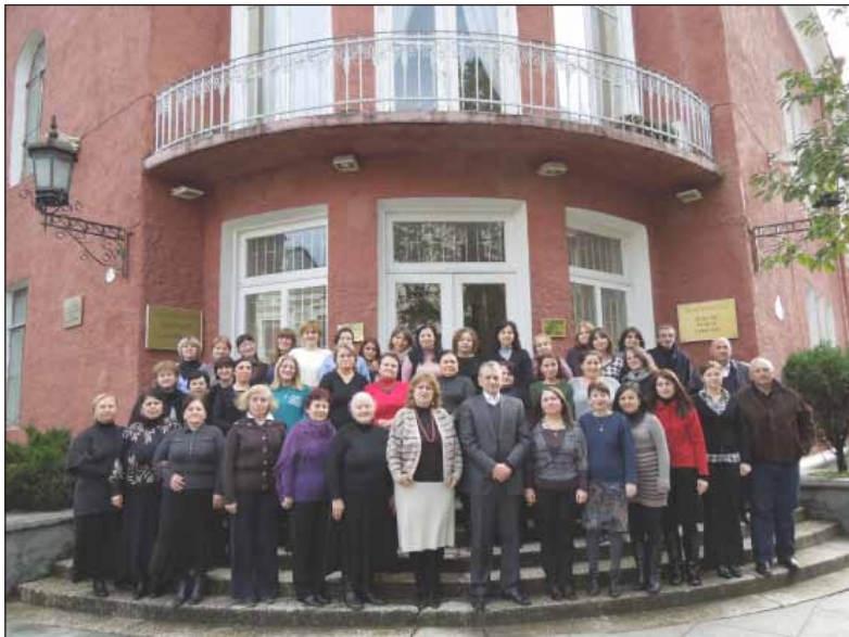
აკაკი წერეთლის სახელობის ბათუმის საჯარო ბიბლიოთეკა 110 წლისაა. 2014 წელი