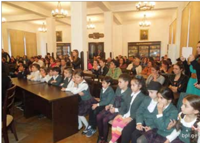
შეხვედრა ვეფხისტყაოსნის ზეპირად მცოდნეებთან