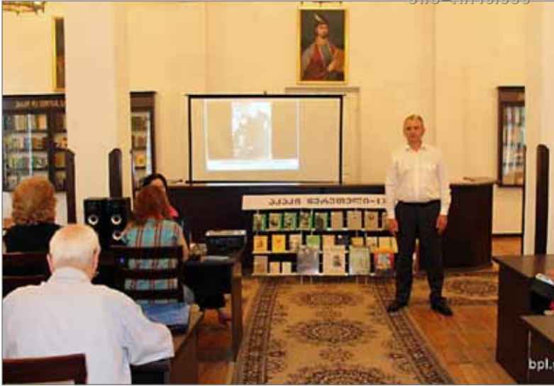
აკაკი წერეთლის დაბადებიდან 175 წლისადმი მიძღვნილი საღამო