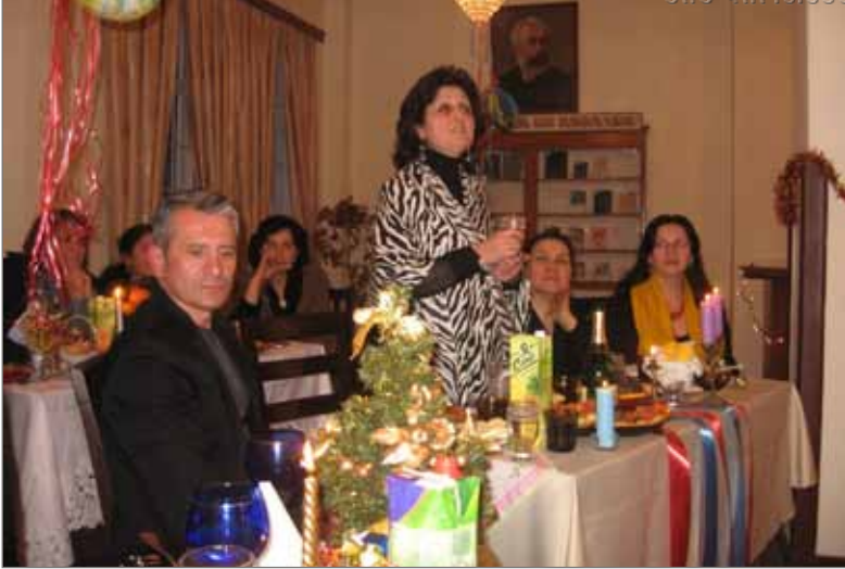
სახალწლო ზეიმი ბიბლიოთეკის თანამშრომლებთან