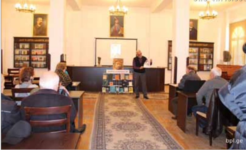
ნიკოლოზ ბარათაშვილის დაბადებიდან 200 წლისადმი მიძღვნილი საღამო. მოქანდაკე ჯიმსონ გურგენიმემ საზოგადოებას წარუდგინა ნ. ბარათაშვილის ბიუსტის მაკეტი, რომელიც ერთხმად იქნა მოწონებული