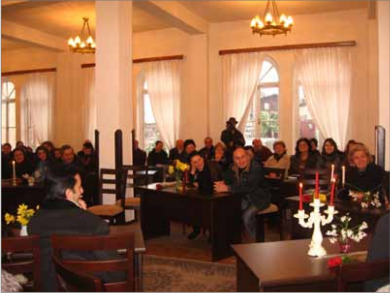
შეხვედრა ბათუმში მოღვაწე შემოქმედ წევრებთან