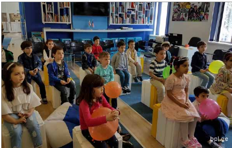
ბავშვთა დაცვის საერთაშორისო დღესთან დაკავშირებით შეხვედრა ალსაზრდელებთან (ძირითად შენობაში)