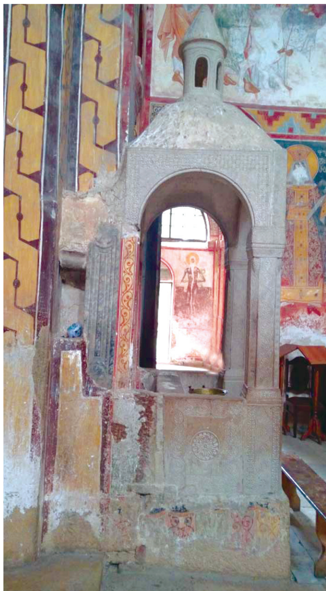
იოსებ კათალიკოსის მიერ აღდგენილი ტახტი ხედი სამხრეთიდან