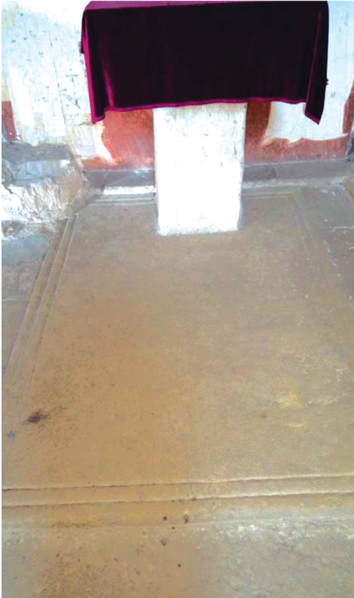
იოაკიმესა და ანას სახელობის ეკვდერი იოსებ კათლიკოსის საფლავი