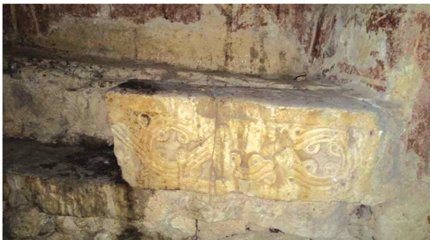
მე-16 საუკუნის ტახტის ევის კიბის ორნამენტი