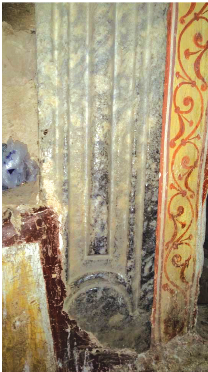
მე-16 საუკუნის ტახტის მარმარილოს სვეტი