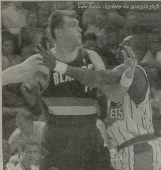
საბონის ავთენტული დაფასებენ

ეროვნულ საკალათბურთო ასოციაციაში დაპირისპირებულმა მხარეებმა პირველი შეხვედრი ნაბიჯი გადადგეს.