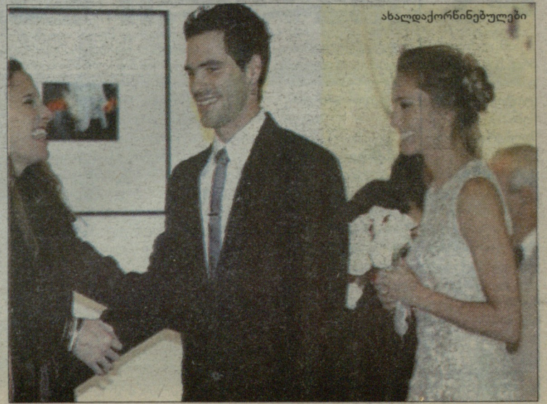
ახალდაქორნილები გვერდით მჯდომი ჯოკოვიჩი და ლეონარდო პეტიტა

ბუშინ არგენტინელ ჩოგბურთელს ხისელა დულკოს ქორნილი ჰქონდა. ის ცოლად გაჰყვა თავის თანამემამულეს, მადრიდის „რეალისა“ და არგენტინის ნაკრების ნახევარმცველ ფერნანდო გაგოს. სპორტსმენები ორი წლის წინ დაინიშნენ და ქორნილის გადახდა ამ ზაფხულს გადაწყვიტეს.