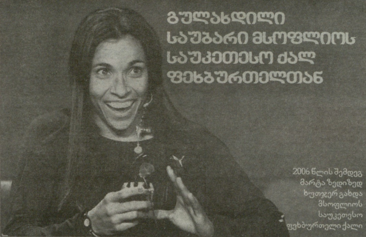
2006 წლის შემდეგ მარტა ზედიზედ ხუთჯერ გახდა მსოფლიოს საუკეთესო ფეხბურთელი ქალი

- მარტა, ხალხს ჰგონია, რომ ქალი ფეხბურთელები ქალები არ არიან, მაგრამ აი, ჩვენ ვხედავთ, რომ ფეხის ფრჩხილები ცისფრად გაქვთ შეღებილი... - არ ვიცი, ვის რა ჰგონია, მე ის ვიცი, რომ როცა ქალი ფეხბურთის თამაშობს და თანაც კარგად, ეს განსაკუთრებული შემთხვევაა. რაც შეეხება ჩემს ფრჩხილებს, მით უმეტეს, ფეხისას, ხან ცისფრად ვიღებ, ხან ლურჯად, ხან წითლად და ხანაც ყვითლად. უმეტესად ბრაზილიის დროშის ფერებს ვირჩევ ხოლმე. აბა, დამაკვირდით, ხომ ლამაზი ფეხები მაქვს? თქვენც იტყვი, რომ ქალური არ ვარ?