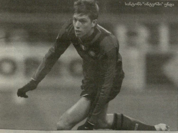
სანტონს „ინტერში“ უნდა

„ბაქსა დელ სპორტის“ მიერ გავრცელებული ინფორმაციის თანახმად, „რომას“ მთავარი მწვრთნელი ლუსი ენრიკე დავიდ სანტონის გადაბრებით არის დაინტერესებული. 20 წლის მცველი „ინტერის“ საკუთრებაა, თუმცა გასული სეზონი იჯარის წესით „ჩეზენაში“ გაატარა. ისეთი პირი უნდა, რომ სანტონი „ინტერს“ არც მომდევნო სეზონში დასტურდება, შესაბამისად, მისი სხვა გუნდში გასვლის საკითხი დგას დღის წესრიგში. ნიჭიერი უკანაზღელის გაყიდვას