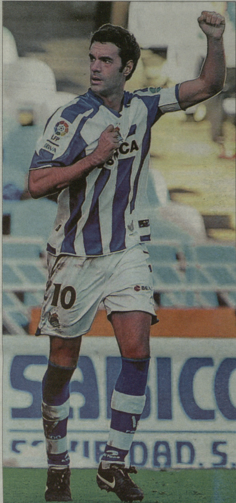
ჩაბი პრეტო, 'რეალ სოსიდადის' ლიდერი და პრიმერას ერთ-ერთი საუკეთესო ფეხბურთელი (7 გოლი, 13 საგოლე პასი).