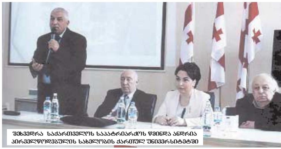
უმხმედრო საპარტიმელოს საპატრიარქოს წინდია ანდრია პირმელორდებულის სახელორის ქართულ უნივერსიტეტში

მან წინააღმდეგობებით საკვს გზა დირსეულად განვლო, საეთაშორისო აღიარება