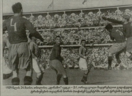
1939 წლის 24 მაისი. თბილისის „დინამოს“ ცენტრში ფოტოტელისპირის პირველი