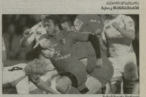
მარტი მდარი (ბურთი)

პირდაპირი თასი გათამაშების მოთხოვნა ერთი გუნდის ფრანგულ "ტულზინს" და მოტადმორი ავსტრიულ "მარტი" მატჩში დასრულდა, რის გამოც ტურის სიმბოლური ნაკრების დასახლება უნდა დაევიანდა. წინა, შესამატ ტურისგან განსხვავებით, აზერული ფრანგული კლბების მორაგებები ურეკონსობაში არიან. საკუბრული მორის ყველაზე მეტი, ზეით მოთამაშე ირლანდიურმა გუნდებმა მაილდესი. თათ-თობი მორაგებ შეცვალა სიმბოლურ ნაკრებში ირლანდიის და უელსის კლბებში. მოტადმორის და იტალიურმა გუნდებმა მე-4 ტურში ნარეგებულად ისპარტა და, ცხელი, გამორჩეული პირები შეცვალა. სიმბოლური ნაკრები 15:2 ფრენდი (ნორსკემბონი), 14:0 მარტი მდარი (ტულზინი), 13:0 კესი ლალუა (კარდიფი), 12:0 რიკი ფლუიტი, 11:0 ტინი ვარდელი (ორიუ-გონსი), 10: ფლემი კონტეგობი (ტულზინი), 9: რუან მონარი (ალსტერი), 1: კანა ლი (ლენსტერი), 2: რანარ მპარი (ოსფრინი), 3: ადამ ჯონსი (ოსფრინი), 4: სანინი ნო (სოსლენი), 5: დომინი ელი (პლანელი), 6: ნონ რიანი (ლენსტერი), 7: მარინი ელიამბი (კარდიფი), 8: ჯიმი მსალი (ლენსტერი).