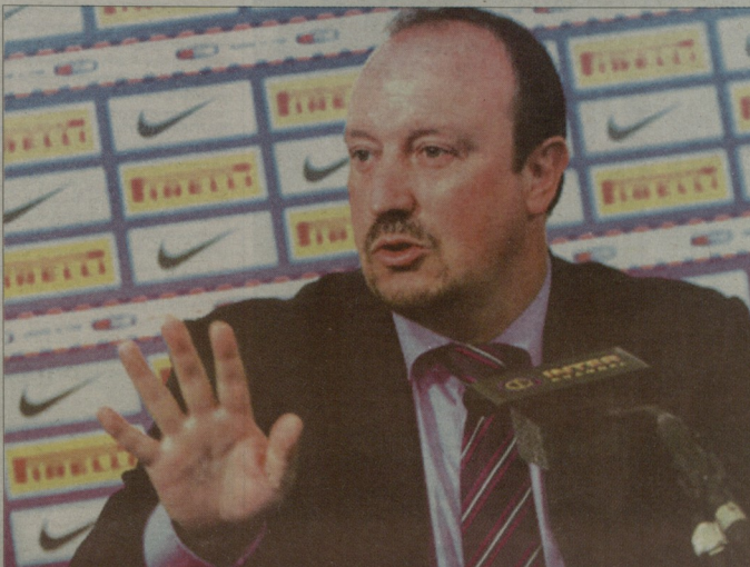
ბენიტესმა ინტერს ხელი დაუწვია...

კიდევ ერთ კანდიდატად ლუჩანო სპალიტის მოხსენიებდნენ, მაგრამ სასკტ-პეტერბურგის „ზენიტმა“ მის განცხადებაზე კატეგორიული უარი განაცხადა და ვაგარიანოვს ავტომატურად გამოირჩევა. ავტორიტეტული ბრიტანული ვებ-გვერდი Goal.com კი ოქტებზე, რომ ხარისხული საბეზღვანთებელი მეკარე და