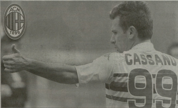
გაგა კასანი მილანი, თუ სამადლორში დარჩება?