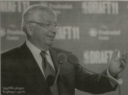
სტერნი ცხელი ზეგულილის