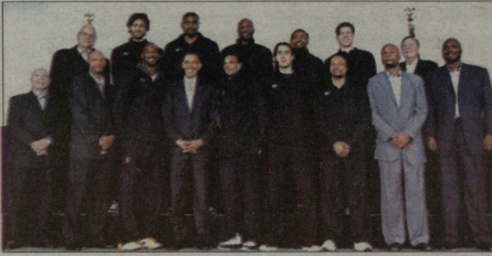
ობამა და ალექსანდრის

მა „ჩიკაგოში“ მომავლელი მტკვლების რადგონობაზე“ - აღნიშნა ობამამ, რომელიც „ჩიკაგოს“ ერთ-ერთი აქტიური გულშემატკვორად მიიჩნევა.