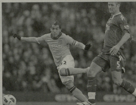
ტეგის შეიძლება დარჩეს