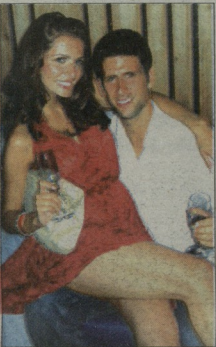
ერინცაძე და მონაკის პრინციპი

მონაკის პრინციპი დაფუძნებული, მხოლოდის მესამე წიგანი ნოვაკ ჯოკოვიჩი დაიბრდა თვის მუგავით ვილდარის რისიკებს, რომლებიც ვერ კიდევ სკოლის წლებიდან შეხვედნა. ჯოკოვიჩის ერთ-ერთი მწველია ინფორმაციით, რომ იგი და ელენა მონაკის განაჩენილი მონაკის ოცის მიზეზი, რომ