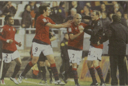
ნავარელმა ნაშის ნინ ქულა ისწეს

„მისტალი“ გაიგნებული, „აღმურების“ კულმენტატორები თეთრი ცვირისხეობებით გვიხატავდნენ თავიანი პროტესტს და გავიციებს ერთად მარჯულ საოვარი, როგორ მოახერხა „ავალიმის“ და 3:1 უპირატესობის მქონე ტაშიმ ისე განაზიდა, რომ მსაჯის სწავნალო სასტუმროს ერთად უზენაესი შედეგი ამოიხსნა. ციხე და მარცხი გარდავალა იყო. თავიდან გავლენის „უპირატესობა“ „მისტალი“ პაკი იყო, რომ არა მერჯერ რეკრიმ ანკარის თი დაედინე გარსებულა, რეკრიმის ნაფილით კი ნავარელმა თითქმის ნახევარი სათი გაძღეს. შემდეგ „მისტალი“ საჯაროობის უზენაესი მქონე, რიგგარეშე სოღელში მოქმედა და „ავალიმის“ 1:0 დანიშნულა. ხუთი წუთი შემდეგვე მინვლეუს კიხადა არიუ