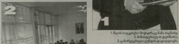
1. წლის საუკეთესო მოქალკეა ენა ნამბალაური 2. მინისტარილის ტურნირის გამარჯვებული გუნდის წევრი ვლადიმერ