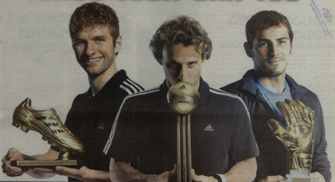
გუშინ „აღმასკომი“ სათავე დასაფუძვლავს (გერმანია) მუნდიალის გამორჩეულმა ფეხბურთელებმა დამსახურებული პრიზები მიიღეს: თომას მიულერი (ოქროს ბუცი), დიეგო ფორლანი (ოქროს ბურთი) და იკერ კასილიასი (ოქროს ხელთათმანი)