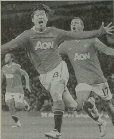
პარკი გამარჯვების გოლს ზეიშობს