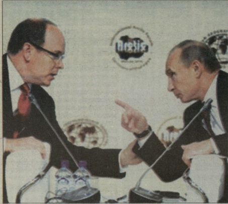
თავადი და პრემიერ-მინისტრი