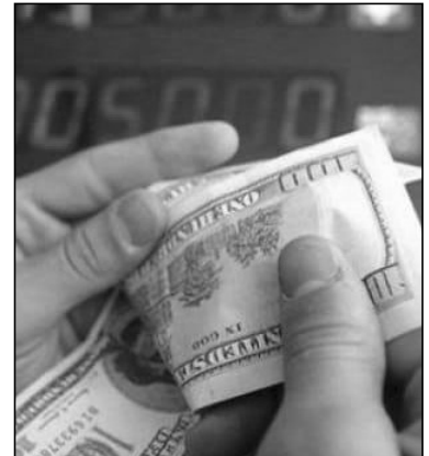
ალიონი. „ვალუტის გაცვლისას გამოიჩინონ განსაკუთრებული

ყურადღება და ტრანზაქციის შესრულებაზე გადაამოწმონ გაცვლით კურსთან და მომსახურების საკომისიო გადასახადთან დაკავშირებული ინფორმაცია. იმ შემთხვევაში თუ მიიჩნეოთ, რომ თქვენი უფლებები დაირღვა, გთხოვთ, დაგვიკავშირდეთ ცხელ ხაზზე 2 406 406“, – აცხადებს საქართველოს ეროვნული ბანკი (სებ). სებ-მა, დედაქალაქის მასშტაბით მიმდინარე შემოწმების ფარგლებში, ვალუტის გადამცვლელ რამდენიმე პუნქტს რეგისტრაცია გაუუქმა. მისი ინფორმაციით, აეროპორტებსა