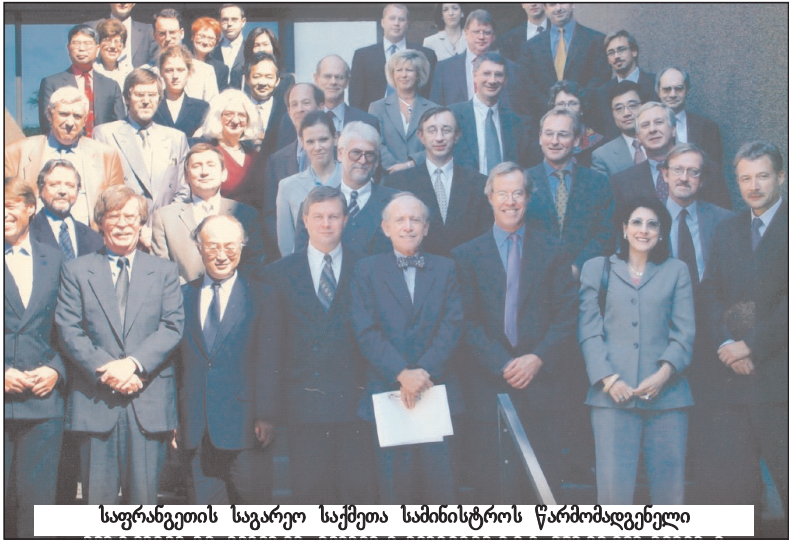
საფრანგეთის საგარეო საქმეთა სამინისტროს წარმომადგენელი

როცა პროფესიის არჩევის დრო დადგა, გადავწყვიტე, დიპლომატი გავემდარეყავი. ამ არჩევანს ქვეცნობიერად, ალბათ, საფუძვლად ედო იმედი იმისა, რომ დიპლომატიის პროფესიით, სამომავლოდ, საკუთ- არ სამშობლოს გამოვადგებოდი. დავამთავრე პარიზის პოლიტიკურ მეცნიერებათა ინსტიტუტი, კოლუმბიის უნივერსიტეტი, პარიზის სახელმწიფო მართვის ეროვნული სკოლა.