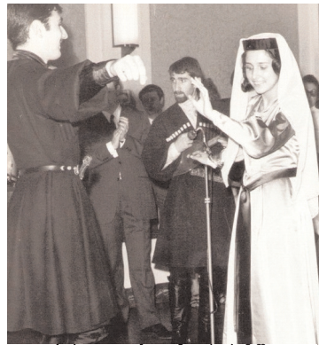
ქართული საღამო პარიზში

ჩემი მეუღლე - ჯანრი საფრანგეთში გავიცანი, როდესაც ის საბჭოთა რეჟიმს დაუპირისპირდა და თავისუფლება აირჩია. მან დამაკავშირა იმ საქართველოსთან, რომელიც თავისუფლების მოპოვებისთვის იბრძოდა. საფრანგეთში ერთად დავაარსეთ „ქართულ-ევროპული