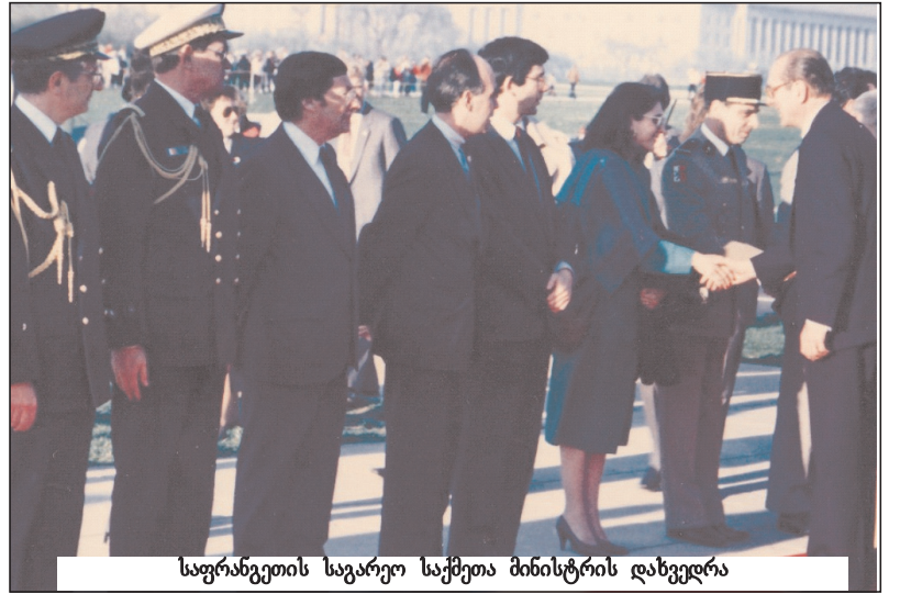
საფრანგეთის საგარეო საქმეთა მინისტრის დახვედრა