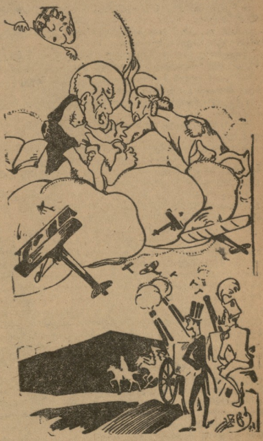
ღმერთი: — ის ობრები თითქმის ჩემი მორწმუნენია, მაგრამ მომავალ მომსახურის ისე უმადობიან, რომ მათი ჰაერობლიანი და ზარბაზანი აქედანაც ამარცხებენ გუ- და-ნაბადს.

წაობს, აგერ რომდენიმე წელიწადია ასრულდეს ერთ და იმავე მოვალეო- ბას, საქმეებს თავს ართმევს. არასო- დეს არ განუტყულებდია, თვითონ მას რამიმ უკმაყოფილება, არასოდეს არ გაუზარებია და ურქვემს ვისმესაგის მითი ასეთი რთული მუშაობისა და მდგომარეობის შესახებ. მისთვის ყვე ლაფერი ეს ერთივე და სამუდამოთ დაკანონებული სისტემა არის. ასე ფიქრობს ყოველი, ასე გინია მას და არ იცის, რომ მიმზადარია და ფერ შეუგნია, რომ იგი თავისდა და სხვისდა უნებურად თანდათანობით, ბელ-ნელა და შეუმჩნეველად „ცრუ- პენტელაზე“ ვახთა. არ იცის ის, რაც უკვე უმეტესობამ კარგა ხანია გაი- გო და მივიდა. არა, ეს ბუნებელია, ეს ყველაფე- რი უარეა. „ცრუ“, ფუ, რა სა- ზიწლარი, დამპირებელი, ადამი-