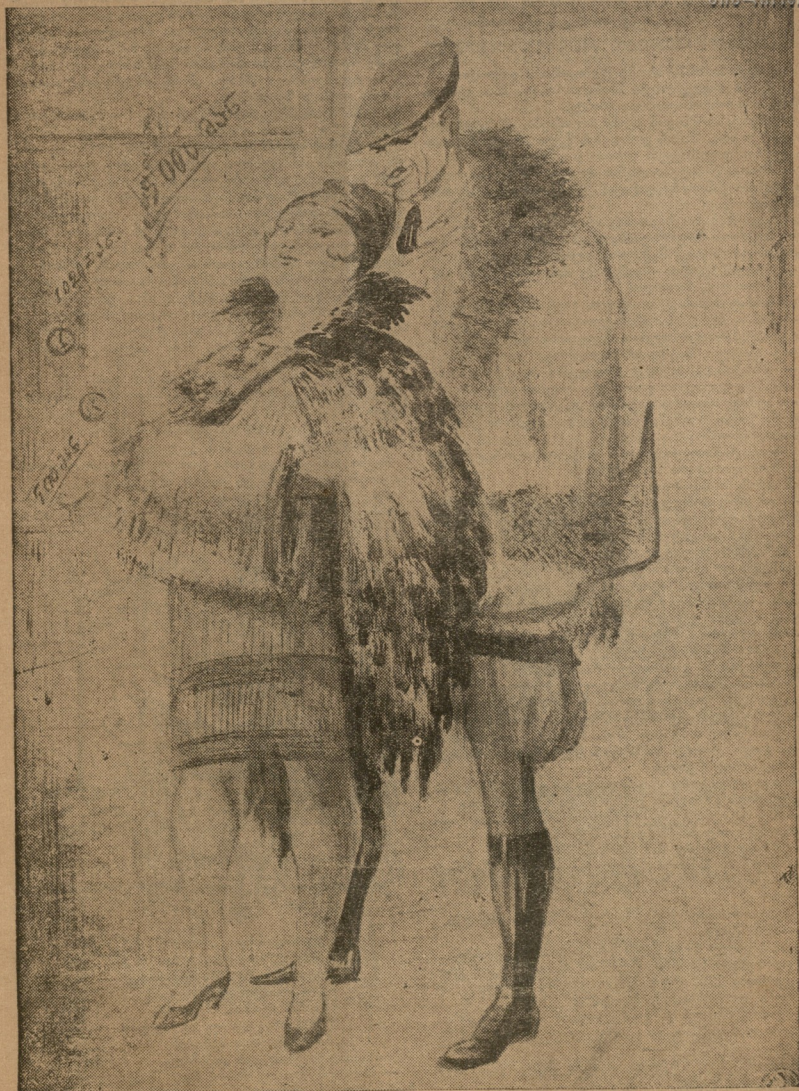
— საზოგადო საჩუქრად ეს ბეჭედი მაინც მიყიდა! — ამდინს იტითაღ ზიკ გავფლანგავ!