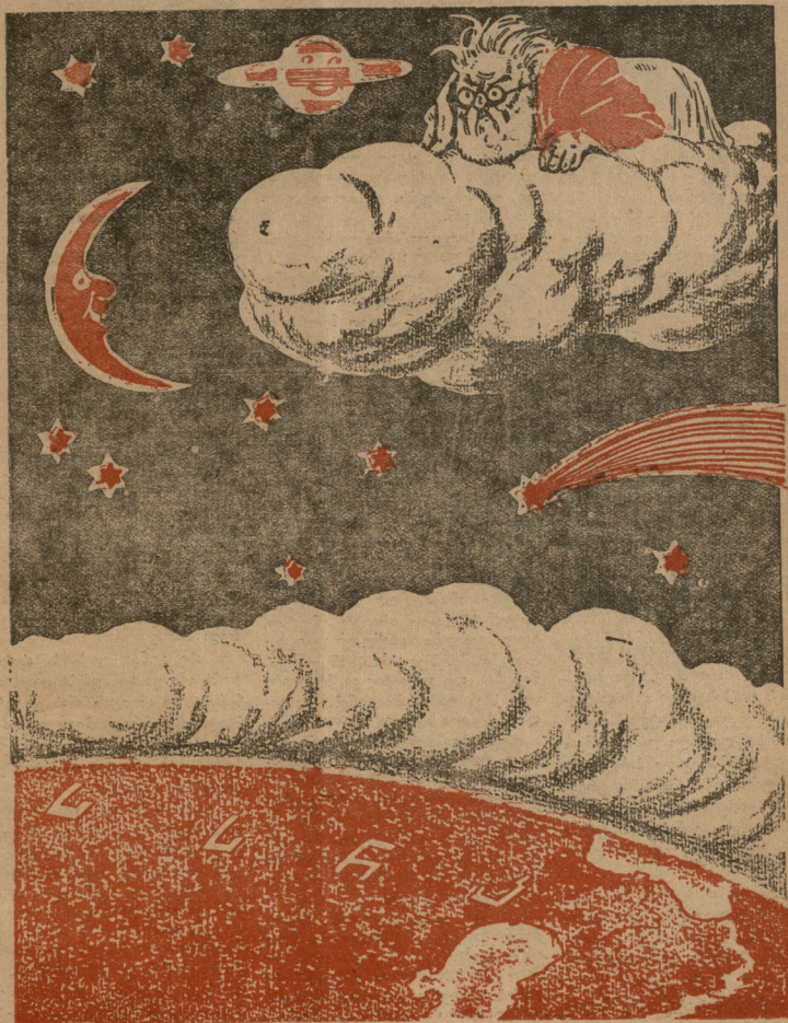
— აფხუზი ზემო გაჩენილი ქვეუნიხ რა კარგი და ზოოთა ნაპერი დამეკარგა