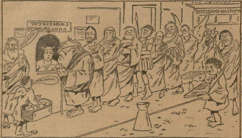
ხმბ რიზიშდანი: ვინ არის ეგ ბებრუხანა, რომ ამ დენი ხანია ფანჯარას აღარ შორდება? მავას რა სამსა- ბური შეუძლია? „სობრეში“ წავიდეს და პენსიას მიხეცემენ... მომრამ ხმბა: —რა დამსახურება მავას მიუძღვის, რომ პენსია დაუნიშნონ!

საქართველო საბჭოთა სოციალისტური რესპუბლიკა