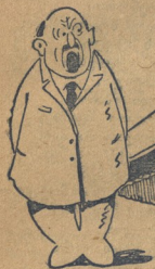
კოოპ. მაღაზიის ბაზმამ: სენა, სწორება მარჯვნივ — პასოსაცემ!