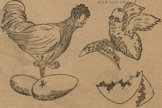
გამოგვეყ... უნდა გახდეს გამოჩენის დამაშვენი. არც ისეთი პატარა ხარ, როგორც ამბობს ვფერი შენი!