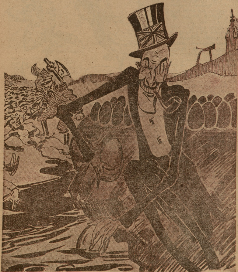
ზის ჩემბერლენი და კვერცხებს ღებავს... და თანაც იგი ასე მდერისა: ადღგომის კვერცხის საღებავით მაქვს წითელი ხისხლი მრავალი ერისა.