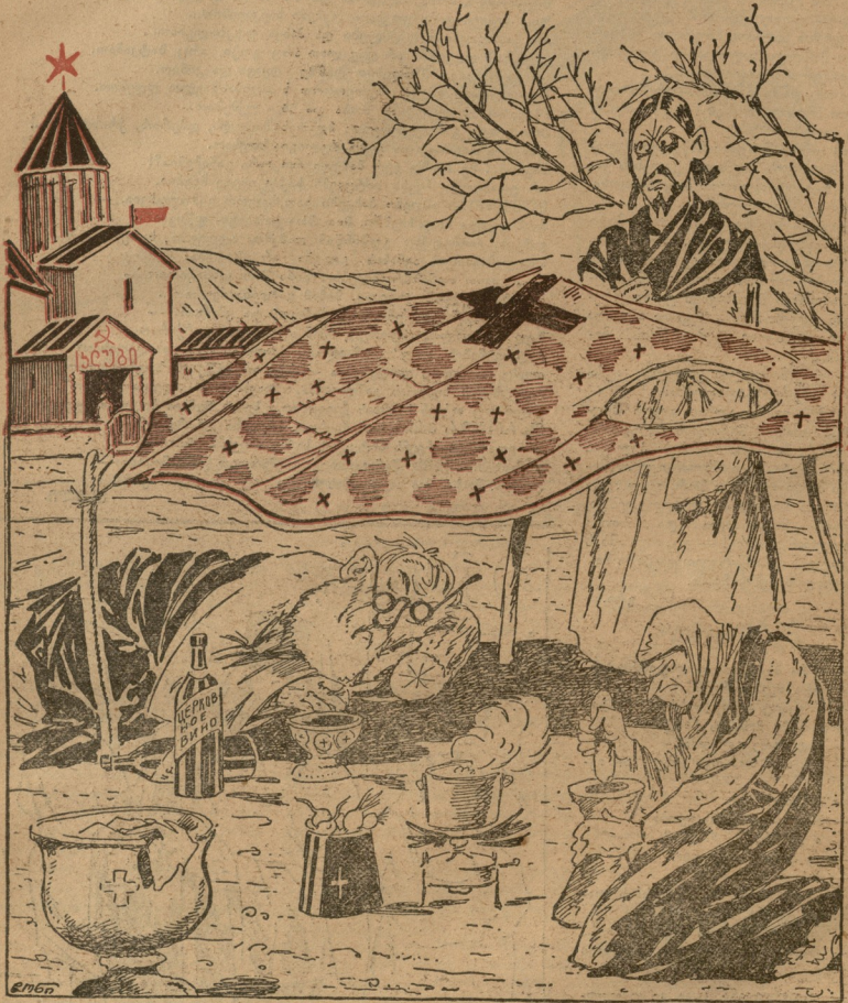
—პრინცი:—ეს არის სამართალი? კომკავშირელებმა საკუთარ ბინიდან გამოგვყარეს და უბინაოთ დაგვტოვეს!