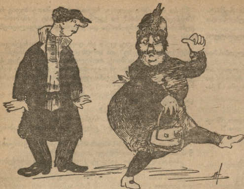
შალი: — მიშველით... ხულიგანი! ხულიგანი: — ვაჰს მე შენი შეგმინდა და შენ რა გაყვირებს?