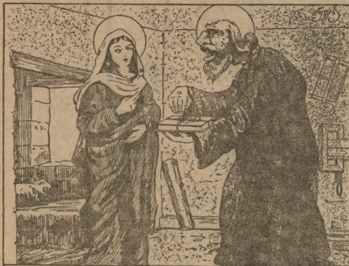
იოსებ დუბაღლი („ღვთისმშობელ მარიამს) — უნდ შემოავიკვდე, ჩემო მშენიერო გოგონას მამა, სამაგიეროო ხ საჩუქარი ჩემვანს!