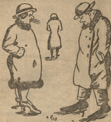
— რას ეჩურჩულეხდი იმ ქალს? მობრძანდი სახლში და იქ ვაგვემ მახუხს! — პროტექციას ვხსოვდოდი — სხვა არაფერს!