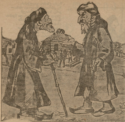
— თქვენი აღმასკომის თავმჯდომარე აღმშენებლობას ეწევა თუ არა? — როგორ არა; ისეთი ორსართულიანი სახლი დაიდგა ეზოში, რომ უკეთესი მთელ თემში არ მოიხატება!