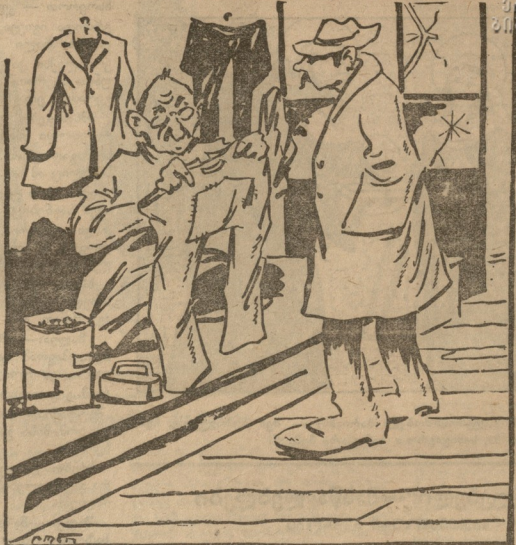
მომალბამი (მკერვალს): — რატომ მზად არ არის ჩემი ხალათი? მკერვალი: — ვერ ხედავ არა მცალია პასუხისმგებელ მუშაის შარ- ვალს ვაკერებ; ხსლომგზე ჯდომისაგან უკან მითლათ დაღვლილილია!