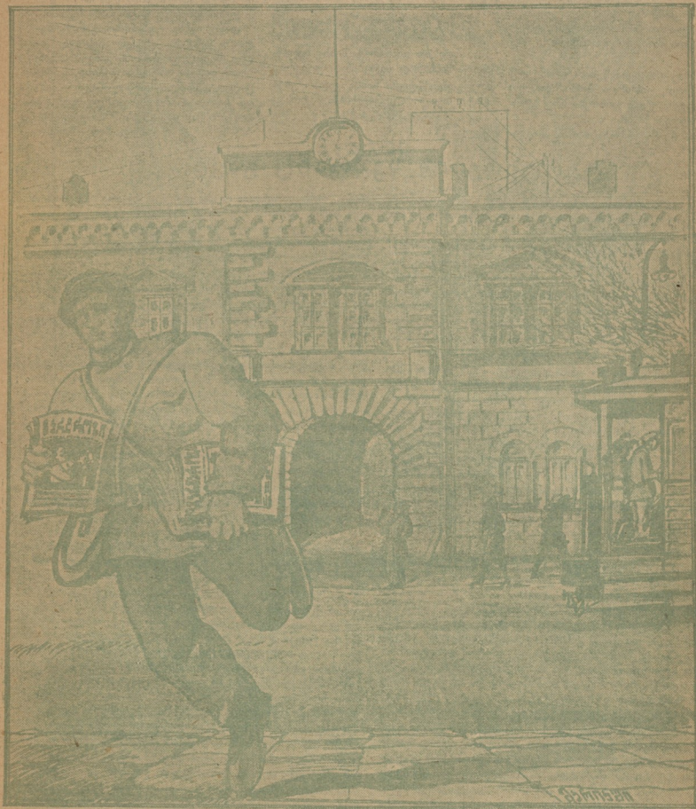
„ბარბროზი“-ს დამბარებელი: — ვისაც ხიცილი გინდა, „ბარბროზი“ იუდეგ... სახვალთა „ბარბროზი“.