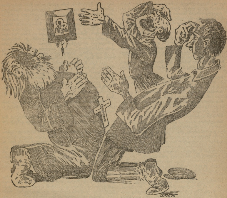
მღვდელი: —ღმერთო მიშველე ანტი-რელიგიურ საწინააღმდეგო კამპანიის ჩატარებაში. ანტი-რელიგიურ კამპანიის „ჩამტარებელი“: —ღმერთო მიშველე ანტი-რელიგიურ კამპანიის ჩატარებაში! ღიაკვანი: —ღმერთო, ყოველგვარი „კამპანია“ —ჭეიფში დამხმარი და კარგი დრო გამატარებე.