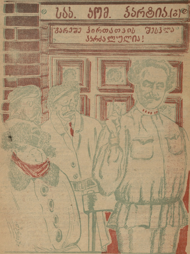
ავტ. ს. ოგუნიძე. (მოთხილავს):— ვერა ხე-ღვეთ ვარტყვებზე წარწერას? აი, ის არის ჩვენი პასუხი.