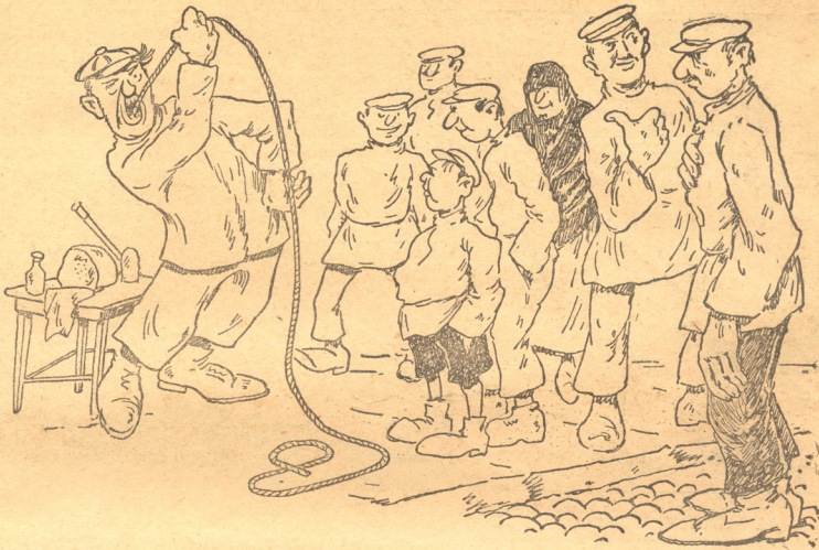
— საკვირველებაა, ეს ჯამბაზი რა ფოკუსებს აკეთებს: ვერ პურს შეგპამს და მერმე პირიდან ათი მხარა ზაწარი ამოაქვს! — შე კაი კაცო, რა გაგიკვირა—ჩვენს ფურნეშინაყილი პური იქნება!..

არ ვიცე, სხვებს რა მოუვიდა და მე კი...თქვენს ავად მახსენებულს ისეთი, რაც მე დღე დამადგა.