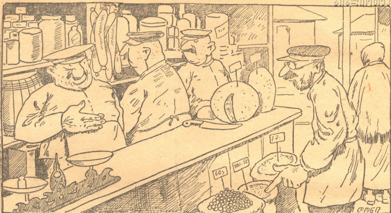
— ეს რა სიძვირეა—სამ ფასით შვილით ყველაფერს?.. — ვა! ზატო ხანნიც ვართ და!