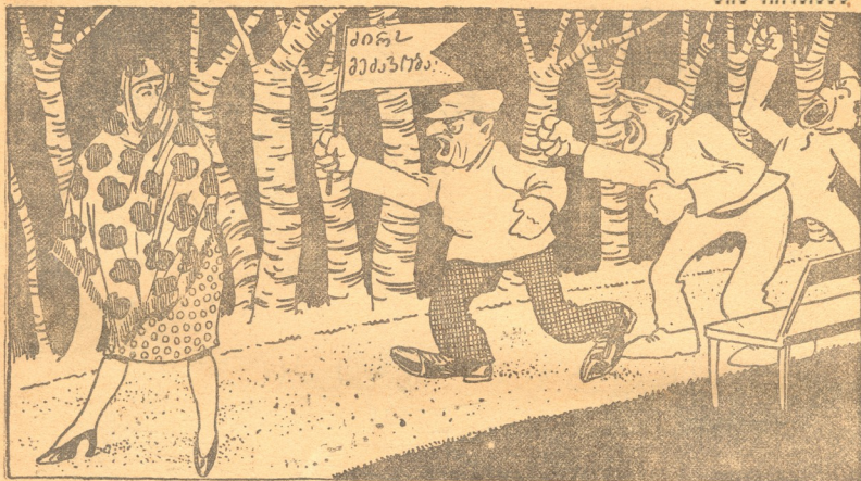
— აჰ გაუშვამთ, ღარიბი, ეს ქალი მებაწება...