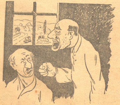
ამა ჩემო ოლიფანტე, მითხარი, თუ როგორ მჟანტებ სახაზინო ფულები...