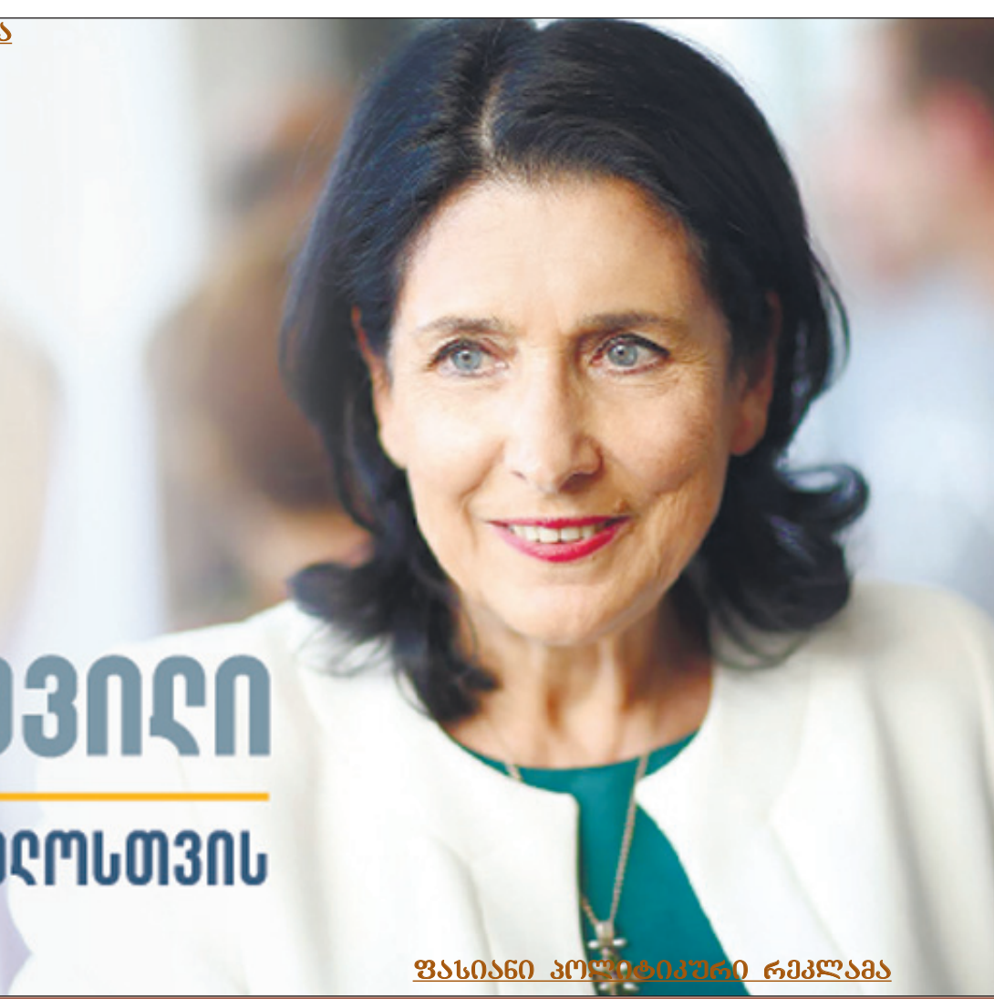
ფასიანი პოლიტიკური რეკლამა

„ალიონის“ გამოკითხვა: ზინ ბახტაძე საქართველოს პრეზიდენტი კითხვაზე სწორი პასუხის გათვალისწინებით რესპოდენტი ისარგებლებს ჩვენი უფასო მომსახურებით – გაზეთში თითო არაკომპლექტური განცხადების ან მილოცვის გამოქვეყნებით