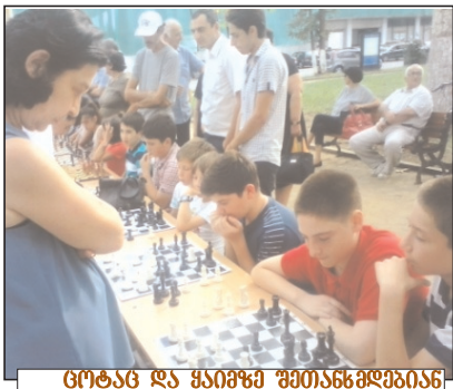
ტობას და ყაიფში შემთხვევითი

ოზურგეთში განსაკუთრებული საჭადრაკო აქტივობები შემოდგომის პირველი დღეებიდანვე დაიწყო, როცა 7 სექტემბერს ჩვენ ქალაქს ლეგენდარული მოჭადრაკეები ნონა გაფრინ-დაშვილი, ნანა იოსელიანი და ვია ვიორაძე ეწვივნენ, რომლებიც „ნონას ოასთან“ ერთად საქართველოს რეგიონებს სტუმრობდნენ. ეს დიდებული შეხვედრა ფართოდ გაშუქდა მასმედიის საშუალებებით, ამიტომ დავამატებ მხოლოდ იმას, რომ სტუმრები ადგილობრივი დარჩა არამარტო გურულების დახვედრით, არამედ იმ ასაღებარდა მოჭადრაკეების თამაშის დონით, რომლებთანაც ერთდროული სეანსი