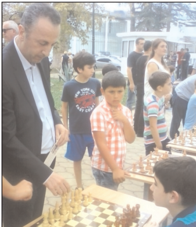
ტმსტ პარტია თინაშვილი და გურიის გუბერნატორის შორის

მიმდინარე წელი, როგორც არასდროს საჭადრაკო ღონისძიებებით მდიდარი გამოდგა არა მარტო ქვეყნის მასშტაბით, არამედ ოზურგეთის მუნიციპალიტეტში და ზოგადად გურიაში. გასაკვირი არაა, რომ აღნიშნულზე დიდი გავლენა მოახდინა საქართველოში პირველად მსოფლიო საჭადრაკო ოლიმპიადის ჩატარებამ და მისგან გამომდინარე დაგეგმილმა საჭადრაკო ღონისძიებების რესპუბლიკურმა და ადგილობრივმა კალენდარმა.