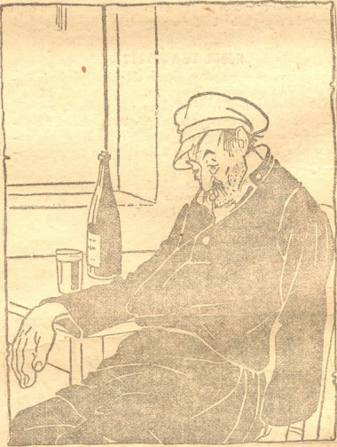
— ნამდვილათ-კი აქ ბრძანდება! („ქრის. პერიც“).

განხილვა გუგუნი ვინ ვინ ა. ავალიანი ყუ ბიძის სპირაძე ვინ ვინ ვინ სპი რაძე