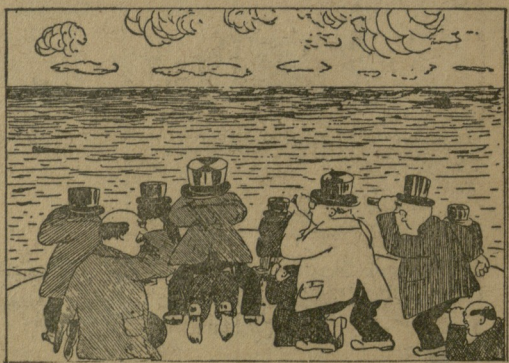
მიოლოდენ ოქტომბრის მონამოვრის წალეკას, ზოლმევიზმის აღსასრულს, შვებთს ზარის დარეკვას.