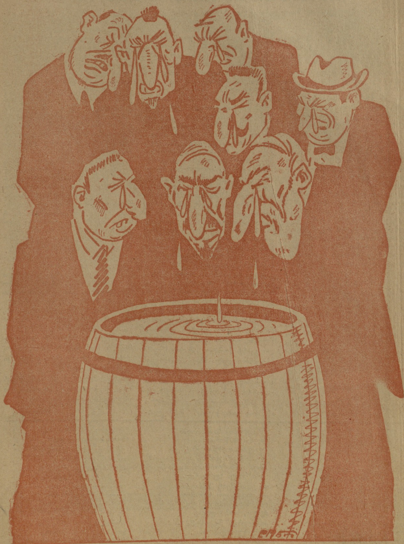
ცემლი ბაზოხდოთ თვალმბ მკუბადჷ შათი ცეოზიბა აძის მკუბადჷ.