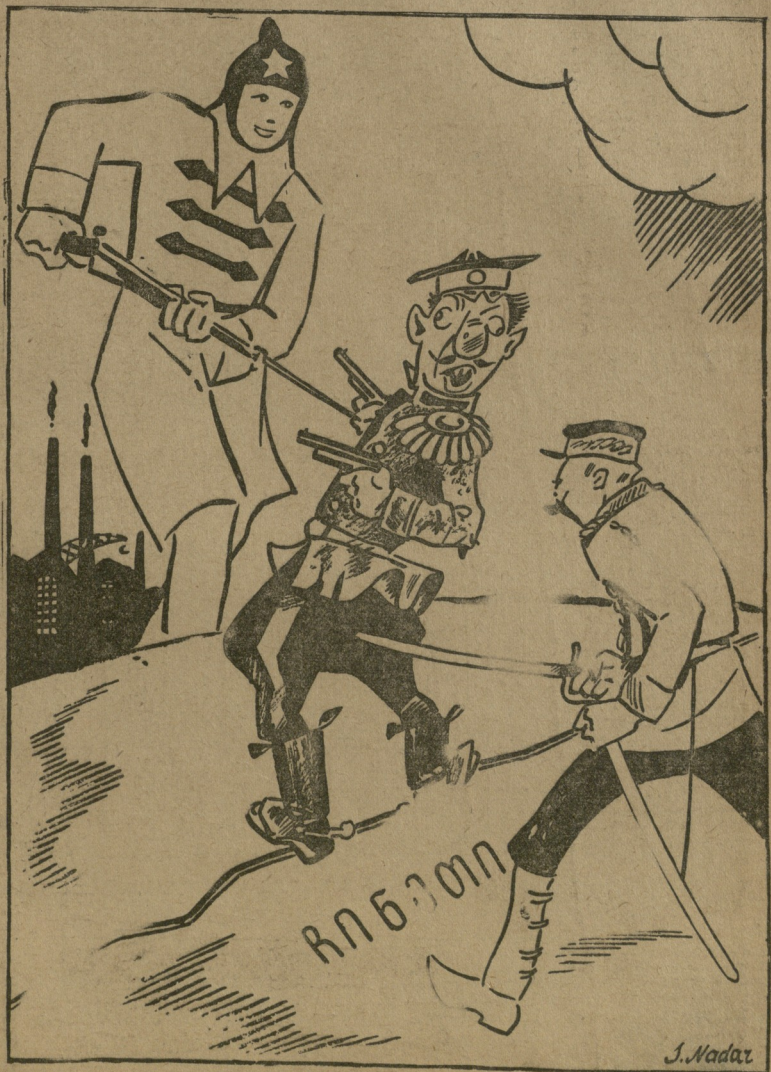
თეთრავარდისი (ჩინელს): — რას იცემებო? ახე იცი ზურგის ვაჟაგოდა!