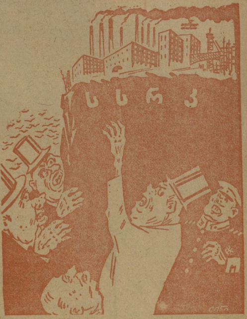
— დროზე უნდა ჩავაქროთ, თორემ ეკმალი თანდათან აქით გადავლიბს. — როგორ ჩავაქრობთ, როცა არსაიდან მზავალი არ არის.