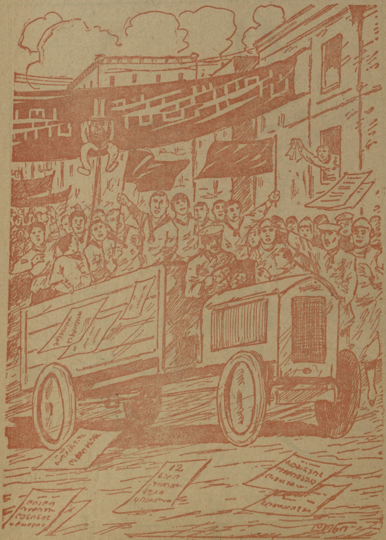
ამ ზეიშია... ნაღობს ხალხი ჭაბლა შერგობენ მხიარულია...