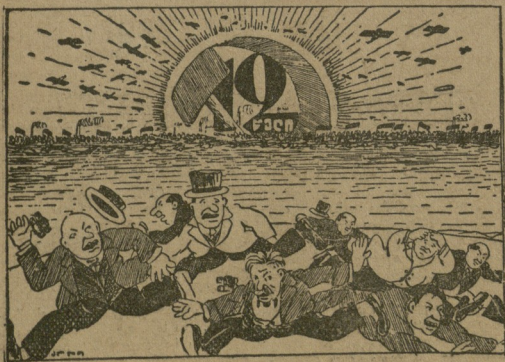
მაგრამ უცებ გაბრაქინდა ცაზე რიცხვი თორმეტი,— მათი დასასრულის და გლოვის წინამორბედი.

მაგრამ ჩათვლემილს მოსცნებს მისი მეუღლენ „გაბრაქებულნი“ აბეუდისგან პრინცესა ძველი, აღვიძებს ხელად და წინ უდებს მოსკოვის „პრაედის“, ბრაზით კანკალობს „ქალბატონის“ ბაგე და ხელი ტყვილი გამოდგა „მამა“ ფოტის გადმოცემულია მოსკოვი თეთრებს, ჯერეთ კიდეე არ აუღიათ, ჩინეთის ჯარით ჯერ შორს არის ლენინგრადიდან. მეფის „არწიებს“ კი აწივლებს წითლებს ტყვია. მოსკოვიში უკვე მეცამეტე ოქტომბერია; დაბას აღებს ცოლი, შიგ არ არის კაპიკი ზვიშტი... — რა ეგამით ბორის? — შენ ვინა ხარ? სმირაო! როტა, პლი! არ მომეკარო. გესერი... მოვალ... მკვდები... გავვიგდო.