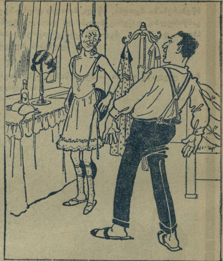
მიმიანლოვსა—გამზადარი, როგორც მეშუაობის რძის დამბარებელი ცხენი, უკბოლო, სახე დანაოებული..

ჩვესს ხვევსა-ადერსს დასსრული არ ესდეგოდა. მერამ რთი მიხდა ტუვილად წერუები ავიმადოთ. თქვენ თვითონ გასსკეთ: რა დღეში უნდა ვუთფადიყავით ახლად ჟვარდაწერილი წველი.