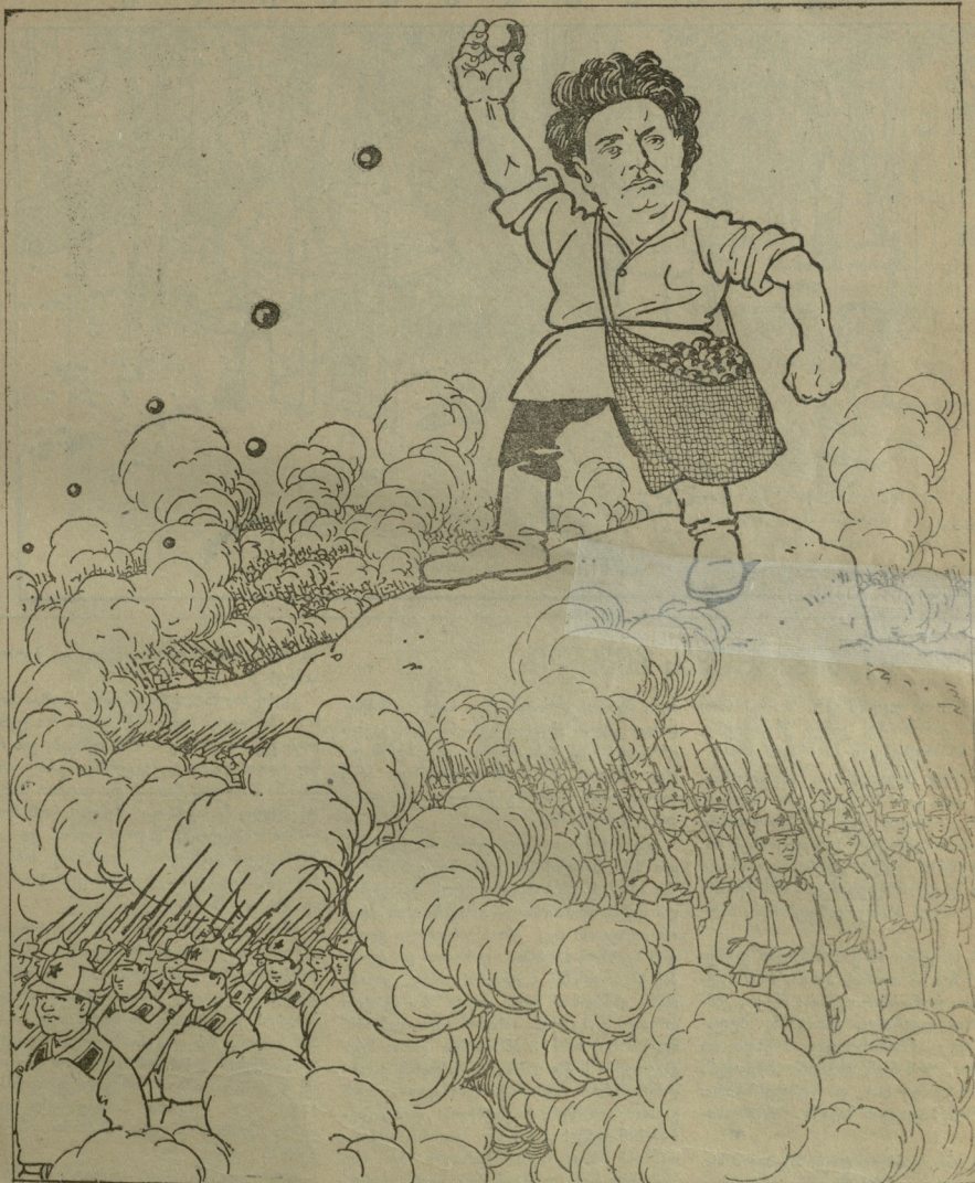
თავის „თვითმფრინავ კომინტერნა“-თა იქ სადღე უნდა გაჩნდებოდა იგო, ერთ ბირთვს ვადისვრის და მთელ მიდამოს დაჰფარავს მეპრძიალთ შრავადლი რიგა.

1 დღე არის და მაინც ყველა ფითიები დაგეშაოლი. (2 ბებერ-ქალის ჰუნჯარეს შობილი და გამოზრდილი) იმახიან: 3 დაგინახეთ ზენო ციში გაფრენილი