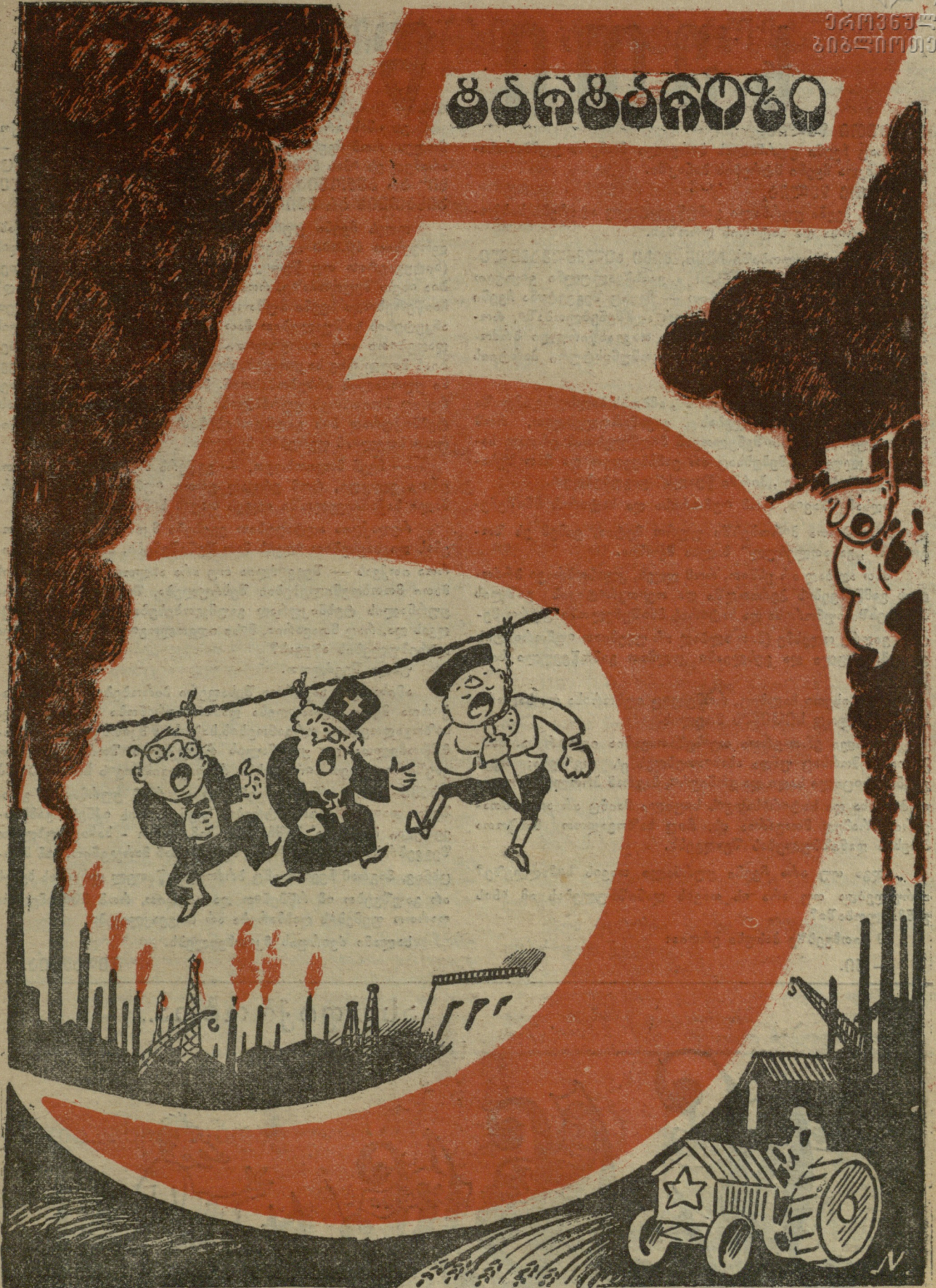
„ტარტაროზი“-ს მიერ შესრულებული ხუთწლიანი გეგმა