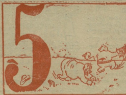
9. ვამთილდა ტყვე ხელი... ძლივს დამატონის თავი... მოკურნოვს... თავს უწყველს... მათ დიდ დადავით მავი.