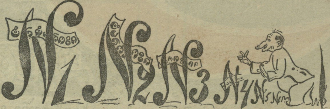
— რამდენიმე ნომრის შემდეგ დაღვეს სულს!