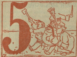
1 ამ ვაგბატინებს ასობის ჩვენი ზრახი და შერი, არ მოსწონთ ამ სული, ჩამოუტყობთ ყურა.