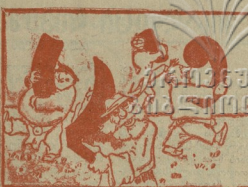
5 გახვებტერებს სული — ნაკურნაქუწი ვახა... გაიანაწლეს მებურად... მათი სრევილი იხვად.