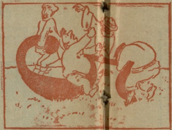
3 წამოაქცეოს კიდე-მხარაზე გულიც წელით. უნდათ ვარეს უფრო მოკლად ხერხით, ფულით.