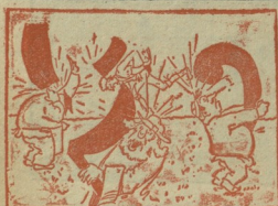
6. მათ ასი სურათი... ვაგრამ ტყავით დამატონ ისე, რომ დეკურავ ამით წაუღებს სიხალისე.