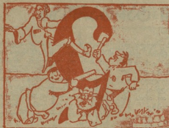
4 და კირამლა დადგეს, მოკლად დამატონ სული. შეუდგენ ხერხებს პობას... მოკლდ სიყვდილს წულით...