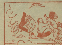
7. შემოუტია სურათი... ტრბობდა ნაწილები. მათი დაიკვა რისებდა. შენიღონენ ვამწურებო!