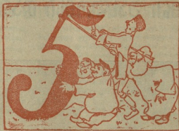
2. და, მა, ტეტერზე მედღათ, რომ წააქციონ სული. (მათ ტხარეკებათ თითოს ძალ-ღონე ასი ფული).