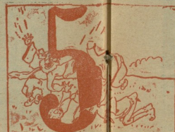
8. ნაწილი ნაწილად გზის ისევ შენდობა სურათი კვერ მოკვიცი... თითოს იღებს სიმამრ ასი ფული