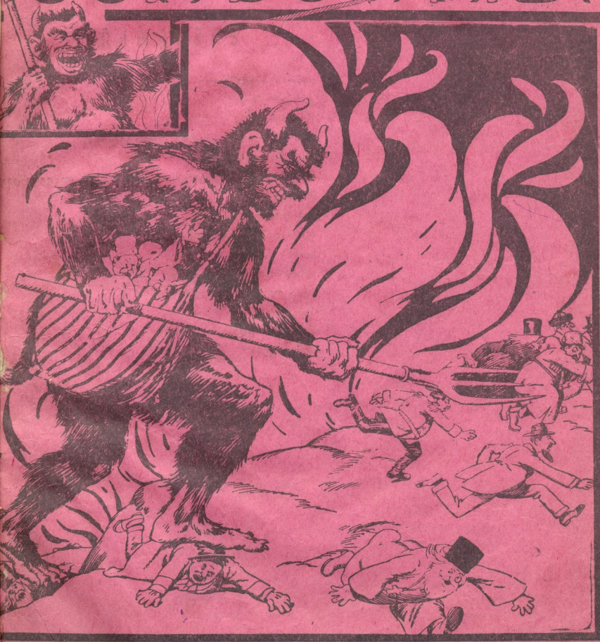
გარბიან ყველა: აზნაური, ჩარჩი, ხუცესი, მათი ნაბიჯი არის მათზე უფრო უგრძესი.