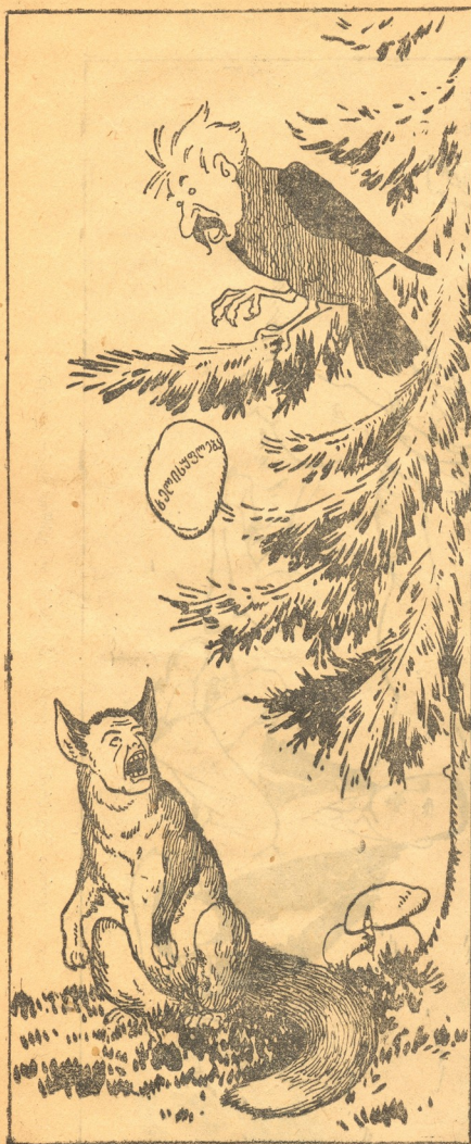
ყვავს გაუგარდა პირიდან ყველი და ჩაისვლა მელიამ ყელი.

ტარტაროზმა მოსვლისთანავე მიაკცია ყურადღება ნენი ქვეყნის ეკონომიურ აღორძინების საკითხს და ჯერ-ჯერობით გახსნა საპნის ქარხანა, სადაც უმოთვრელად მზადდება სარეცხი საპონი.