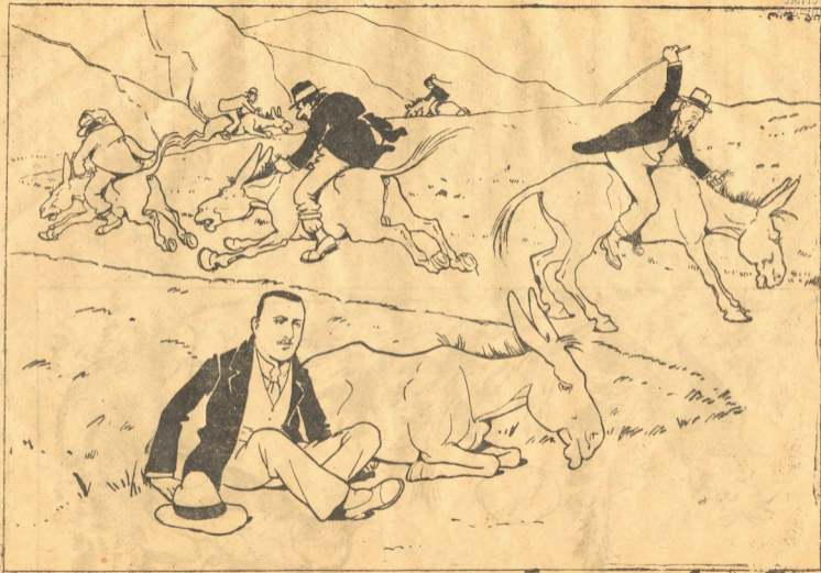
ჯორთა შეჯიბრებაზე... ჯორთა შეჯიბრებაზე, გასწით ჩვენო ჯორებო!