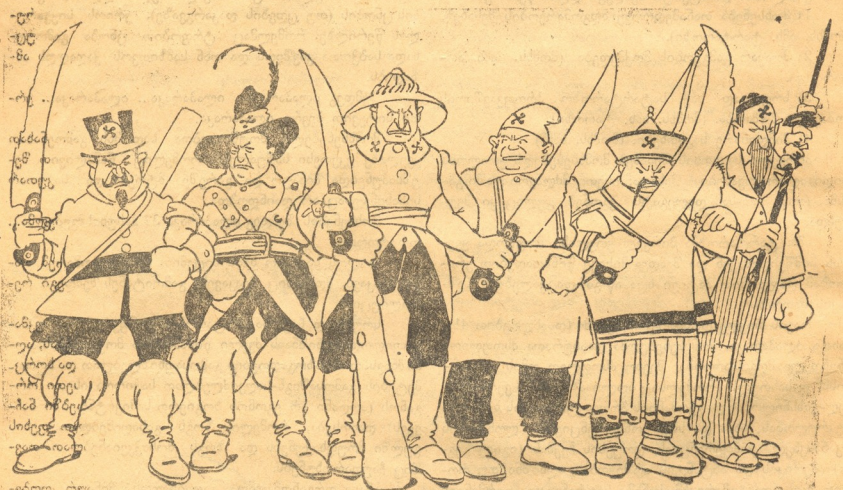
„ფაშისტებო ყველა ქვეყნისა, შეიარაღდით.“

რეზოლუციის მიღების შემდეგ გაიმართა საღმრთო-სასწავლო სხდომა, მოაწვევს ოქტიაბრინი. განსაკუთრებულმა კომისიამ გამოიყენა ხელში აყვანილი სანდოიანი სახის ყმაწვილი და ჩაავლო იქავე მომზადებულ ქებაში; რომელშიაც იყო მაჭუთი, ნავთი, ქვა-ნახშირი, მარგანცი და სხვა დავიდარაბა. შემდეგ ამოიყვანა და გამურული დასვეს იქავე ხალიჩაზე. კონფერენციამ მიიღო შეფთა ამ ყმაწვილზე და სახელათ დაარქვა ტარტაროზი. ტერსიტი.