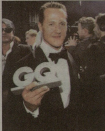
მიხაელი პრიზი ხელნი

მაგრამ "ბილი" წერს, რომ სინადადეგით მიმდინარე მოლაპარაკებების მთავარი თემს კონტრაქტის ხუთი წლით განახრძელდება და "უილიამსი" არ ამირებს ახლანგას და ბიოტის გამეცებას.