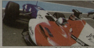
ამერიკელებს პირობება აქვთ

მრავალწლიანი პრაქტიკულად მიიღო წელი ტურნირებზე შუაზაზრობის ანგოზებენ და შესაბამისად, ნაკლები დრო რჩება პრადი ცხოვრებისა და გართობისთვის. ამიტომაც მათი ნებისმიერი გამომწერა რომელიც არასპორტულ ღონისძიებაზე, მიიღის ჩვენებებსა თუ ფოტოსესიებში დიდ ინტერესს.