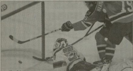
ტორენტოს გოლი შემსრულებელი