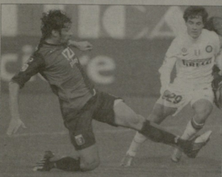
კახა კალაძე ინტერთან მატჩში