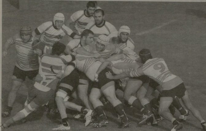
ლლოვისლი/სიონი თამაშ ელემენტების ფოტო (www.sport.gov.ge)