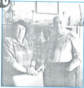
და სხვა სანტიმეტრებს მასლები

6 თეარ ბართია ყოველ საღამოს შეშობის ჩვენს ოჯახებში