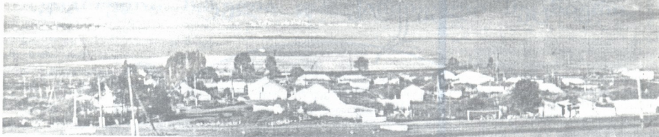
მე ჯავახეთს რა მიზავდაო, მთავრე მადგა მშესავითო,