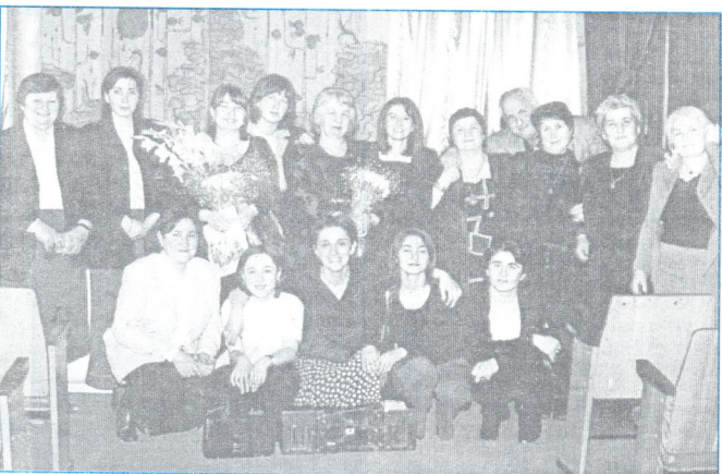
● სკოლა „ნაკადულში“ მისწავლებლები

.....ნაკადულში სწავლებას შეუქმნე შენი მძინერა. დოგინე