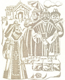
● დღესტრაციები დღია შვავხვების შიშისნათესავის „კაცია ადამიანი.“

– მე კი მგონია, რომ ეს თავისებურება ყველაფრის თავისებურ, ორიგინალურ აღქმაში გამოიხატება. ჩემი მხატვრობა ქმარ-შვილს შეეწირე. დიდი ხანია თითქმის აღარ ვხატავ. ჩემს ოჯახს წლობით