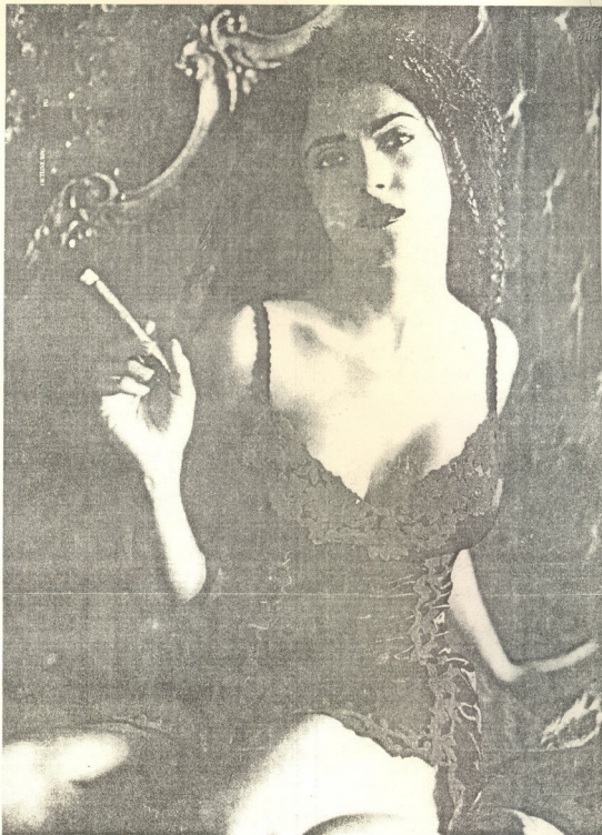
● სელმა ჰაიეკი

მზეთუნახავი ბო დერეკი, რომელიც ფილმ „10“-ის შემდეგ პოლიუდის სექს-სიმბოლოდ აღიარეს, კატეგორიულად წინააღმდეგია ქირურგიული ჩარევისა და აღნიშნავს: „ქალები, რომლებმაც პლასტიკური ოპერაცია გაიკეთეს, ერთმანეთის მსგავსად გამოიყურებიან. ამას წინებზე ლოს-ანჯელესში ვსადილობდი და საშინელმა გრძნობამ შემიპყრო - ყველა, ვინც ჩემს გარშემო იმყოფებოდა, ერთმანეთის ასლს წარმოადგენდა: ერთიანი ცხვირები, დანებები, მსგავსი ნიკაპი, სხეული, და ქერა თმები, ეს ხომ არაბუნებრივია. მოვა დრო, როცა ყველანი მოვხუცდებით და ალბათ თითოეულმა თავად უნდა გადაწყვიტოს, როგორ ებრძოლოს ამას, მაგრამ მე იმ ქალებს ვცემ პატივს, საკუთარ ასაკზე ახალგაზრდულად რომ არ გამოიყურებიან და მაინც საოცარ მიმზიდველობას ახსიებენ“.