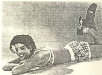
● ლიზა მინელი პრესლი