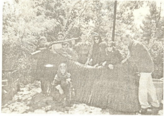
თეატრის დასი ირანში

ირანულმა ფესტივალმა დაგვანახა, რომ დროა თოჯინურ ხელოვნებაში ახალი გზები ვეძოით. რუსთავის საბავშვო თეატრის უნიკალური წარმატება ნუ შევკვიპმის ილუზიას, თითქოს ამ ფანტომ საქართველოში ყველაფერი რიგზეა. თანამედროვე მოთხოვნებს ფეხი დროზე თუ არ აყუწყვთ, დიდ წარმატებებზე ოცნებაც კი აბსურდული იქნება.