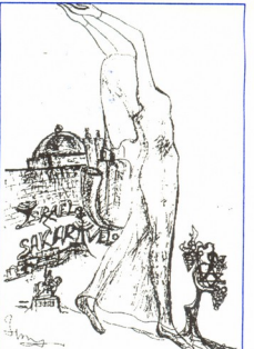
● მ. სოლომონიშვილის ნახატები