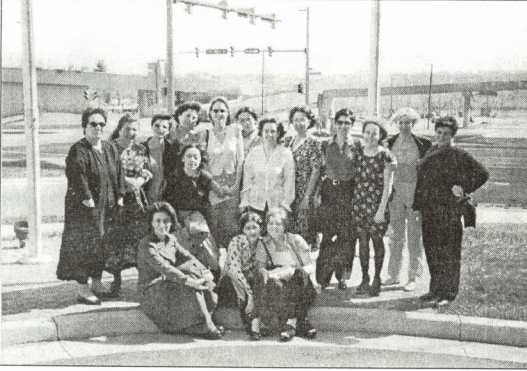
● ვაშინგტონი. კონფერენციის მონაწილენი