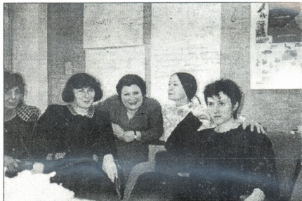
● ვირჯინია. საქართველოს დელეგაცია მეცადინეობს დროს

ინტერნეტში ჩვენ გავეცანიო პროექტს „ქალთა ქსელი აღმოსავლეთი და დასავლეთი“ - ელექტრონული კავშირის ორგანიზება. აქ ვნახეთ აფხაზ სეპარატისტთა მიერ გავრცელებული