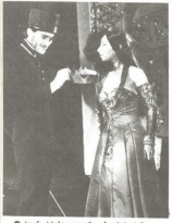
● სენს სექტადონს „სივრცის სი-სახლი“ სივრცის — ლ. ალექსანდრე სივრცის — მ. კერძაშვილი

ა სახლია უნდა დაიხადო, შეუვალი შრომა, მიწოდებით, მონაწილეობით ბევრს მიადევნა შემოსულ კარიერაზე შექმნა, მდგრად... თუ ღმერთმა დაგვიღო ის ნაწარმად, რადაც იგი თავის რწმუნებულს ასწავლებს, მაღალ კვალიერობებზე სავალი არ შეუღებია.