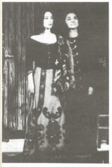
● სენს სექტადონს „სახლას ქი-აფი“ სახლი — ლ. ალექსანდრე ფიქსი — მ. კერძაშვილი