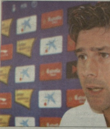
მავრისიო პორტინიო კლუბში 2012 წლამდე რჩება

„სპანნიოლის“ ხელმძღვანელობამ კონტრაქტი გააუხანგრძლია არგენტინელ მთავარ მწვრთნელ მავრისიო პორტინიოს. ახლა 38 წლის არგენტინელი 2012 წლის ივლისამდე მარსელურ კლუბის თავაკია.