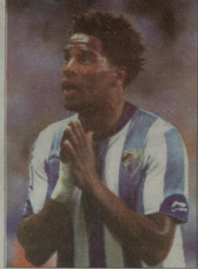
ელიზბუ ნიოელ მართის აპრეტესტებს

რისიის გამოხატვის გამო დაუტოვა. ანდალუსური კლუბის ნიოელმა გამართილად სხვათა შორის, ეს მცირე შემთხვევა ნიოელდელ ლა ლიგამ, როცა ფეხბურთელს ნიოელი მართაი გაუტოვებს. სამართალმა ბოლოს პური კი ქამა, მავრამ სწორედ ამ გაძევების გამო „მაღლაგამ“ შინ 23 ნაგეო „ეილარეკლიანო“ ბუნებრივია, ანდალუსიელებს დეკარგულ ქულებს არაინ თუნახაურებს. 26 წლის სწორედ ეინგრეს არ გასტყვებია „მაღლაგასთან“ შემხვმა, ის ხომ 2 სეზონის განმავლობაში (2007-2009) ამ თამაშშიდა, სანამ მილიონ ევროდ რომის „ლოდინგე“ გადამარტყვინდა, ეილხუ თავიდანვე „მაღლაგამ“ სასტატური შემაგველილის რეკლამად ნიევერ გახდა. შეუახსენებთ, რომ ელიზბუ მანამდე ელ სეზონის მე-2 ნახვერი იფართო „სარავისამი“ გატარა.