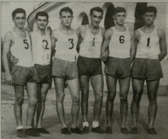
თბილისის „ნავუას“ ფრენურთელთა გუნდი. 1930 წ.

სურათი, რომელსაც დღეს ვიხევათში, 80 წლის წინათა ვადღებულ თბილისში. იმ პერიოდში საქართველოში ერთ-ერთი სოლიდური სპორტული საზოგადოება იყო „ნავუას“. რომელსაც საუკუნის გუნდები ჰყავდა სპორტის საბაში სახეობებში. 1926 წლიდან საქართველოში დამყო ფრენურთის დაწვევა, თონსები იყენენ — კლამაშორელები. „ნავუას“ ბაზაზე ჩამოყალიბებულ ვაქ ფრენურთელთა გუნდის წევრები საქართველოს წარების დასაყრდენს წარმოადგენდნენ. მისი წარმომადგენლები თამაშობდნენ საკავშირ ნაკრებში.