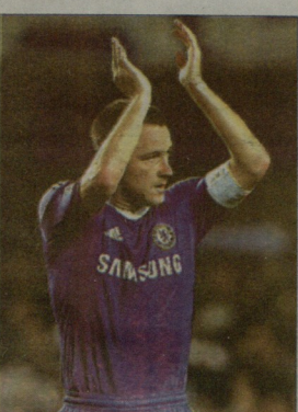
ჯონ ტერის თქმით, ჩელსის მარსელთან მატუბი შეინახა

ჯონ ტერის თქვა, რომ „ჩელსი“ მარსელის შემხვედრის ატარს“ იტყვი სურავ, რადგან ერთხან პრემიერლიგაში არსებობისათვის ილის შეხვედრა და ფუნქციონირების ძალების შენახვა სჭირდება. შეგახსენებ, რომ ტერის, რომელსაც გოლი ექვსი თვის განმავლობაში აღარ გაიტანა ჩემპიონის ლიგის სამამაზის შემხვედრია შემხვედრის დასაწყისშივე მიადგინა მიხანს - მე-7 ნუთხე კუთხოვრად ჩანოდედელი ბურთი სტუმართა ბადეში შეაქვინა.