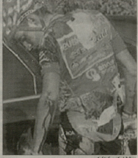
იგორ ანტონი ავარიის მუდგე

როგორც დადინდა, მასობრივის მოულოდნელი სიკვდილის მიზეზი უცნობი ფრისკი ვადა, რომელიც სისხლის მუხარია. მაგრამ გუნდის ხელმძღვანელებმა განაცხადეს, რომ გუნდის სიკვდილის და სპორტსმენების ავადმყოფობის ანაგრივი სერვისი. მოულოდნელია, Team Sky-მ ველობა მიტოვა და ეს გადაწყვეტილება დალეული მასობრივის სიხრებას და მრბოლბუტის ვანმართობის მუხარეობას დატყუებდა. გუნდის ყველა წევრმა და ტენიკურმა პრეტორის სისხლის ამბავი ჩაიხარა და საზოგადოება ვა-