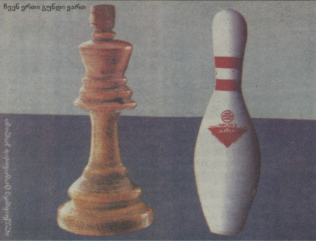
ჩვენ ერთი გუნდი ვართ