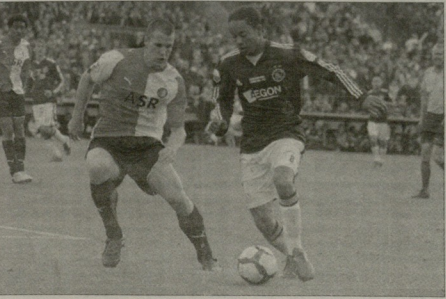
გენერალის და ვლადის დევილი მარანდელი კლასიკური