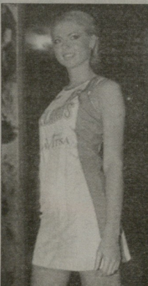
ბელარუსები კაბებით თამაშებენ

2009 წლის ვეროასკეზე ბელარუსმა მეოთხე ადგილი დაიკავა. ერთი წლით ადრე, მეკონის ომბაზე - მეექვსე იყო. წელს მსოფლიოს ჩემპიონატი 23 სექტემბრიდან 2 ოქტომბრამდე ჩემპიონთა გაართება და ბელარუსისგან მუდღის მოპოევისა ელანა.