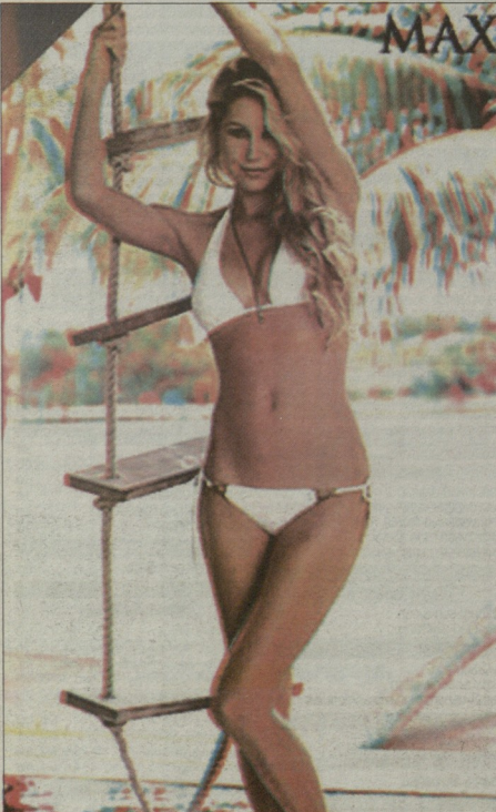
ოქტომბრის ნომრის გარეკალი