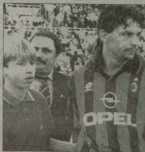
დიდი რომი და პატარა ანტონიო

ბაზოზის ესტრეტიკითან გამაროული პაქეობაზე დეკლარაციის და ხოვადედ, აპოლონი“ არსებულ ატმოს-