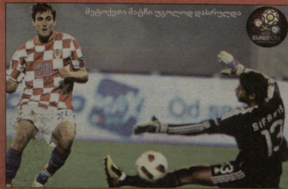
მეტოქთა მატჩი უკოლოდ დასრულდა