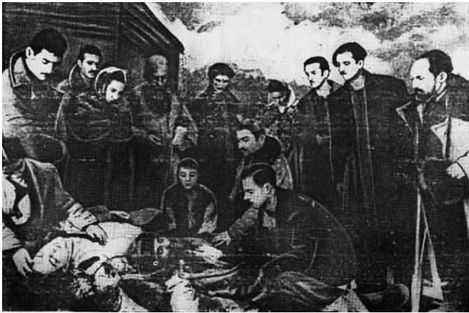
სცენა სპექტაკლიდან „ქარიშხლის წინ“

სოხუმის ს.ჭამბას სახელობის დრამატული თეატრი — „ქარ-