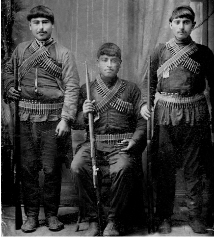
გარეკახელი „შავნაბდიანები“ 1890-იანი წლები

თის მიერ დანესებულ სამართალს, ანუ სჯულის კანონს, ნაკლებადლა ქადაგებდნენ. თავადაზნაურობა, თვითგადარჩენისათვის, მამულების გაყიდვით იყო დაკავებული. ყოველივე ამან კი მშრომელი ქართველი ბოგანო გლახებად აქცია.