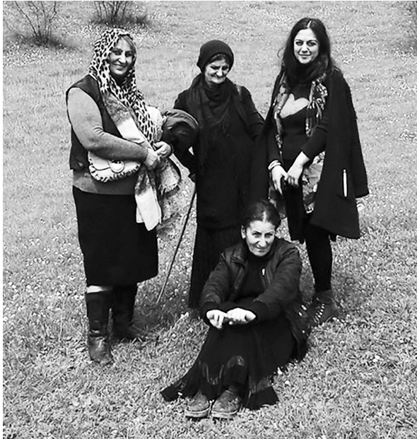
გარეჯის დოდორქის მონასტრის მრევლის წევრები