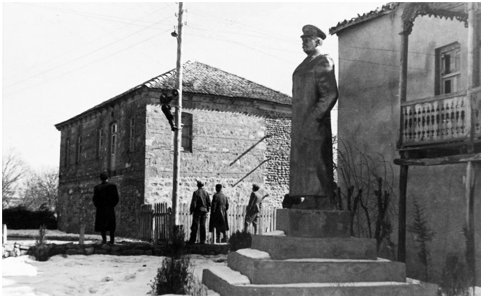
ი. სტალინის ძეგლი ამშვენებდა პატარძელს (1948წ.)

საქართველოს რუსეთთან შეერთების შემდეგ პატარძელელებმა თავი გამოიჩინეს სპარსელების წინააღმდეგ (1826წ.) ბრძოლაში. მაშინ სოლომონ ბუტულაშვილი სახალხო გმირად აღიარეს. ჩაენერნენ მოხალისეთა დრუჟინებში, როდესაც ბრძოლები მიმდინარეობდა თურქეთის წინააღმდეგ, ბათუმის, ყარსის, არტაანის გათავისუფლებისათვის. 1924 წელი სისხლიანი გამოდგა პატარძელელებისათვის. ბევრი დახვრიტეს. მეორე მსოფლიო ომმა 350-მდე პატარძელელი ახალგაზრდის