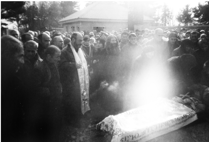
დაკრძალვისას მამა შალვას ცხედარს ნათელი დაადგა

ეს იყო ბოლო ნაშრომი სამშობლოსათვის დაუღალავი შემოქმედისა, მოძღვრისა, რომელიც თავისი გასაოცარი თავმდაბლობით შესანიშნავი მაგალითი გახლდათ იმ იშვიათი ქართველისა, რომელსაც გულთან მიჰქონდა თავისი ქვეყნის გასაჭირი. დღე და ღამე ლოცულობდა ერისა და ქვეყნის გადარჩენისათვის. ჩვენ ხშირად ვსაუბრობდით ჩვენი სამშობლოს შესახებ, რა გზა უნდა მოძებნილიყო ამქვეყნად მისი გადარჩენისათვის. თუმცა ეს გზა წმინდა ილია მართალმა საუკუნეზე მეტი ხნის წინ დაგვანახა. როგორც ქართული სიტყვის დიდოსტატი კონსტანტინე გამსახურდია ამბობდა: „მე არ ვიცი, ჩვენ წინ ნავედით თუ უკან ილიას შემდეგ, ამაზე სხვებმა თქვან, ის კი ვიცი, რომ მისი ერთადერთი ფიქრი და ზრახვა ჩვენს მარად სათაყვანოს დასტრიალებდა თავზე დღენიადაგ. და მაგონდება დარიალის ხეობაში გაბურძგვნილ, ტყაპუჭიან მოხვევესთან მოლაპარაკე ილია ჭავჭავაძე, მან ყველაზე უკულტურო ეგზემპლარს ქართველთა შორის ათქმევინა ის დიდი სიტყვა, რომელშიც 30 წლის კამათის