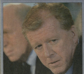
სტიპ მაკლარენი ოფიციალურად წარადგინეს