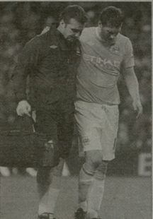
გარეთ ბერძენი ფაბიო კაპელო დაამტკიცა

ბერი კაპელოს გუნდთან ერთად აღსაწერია არ დაბრუნდება. ის სიტისს სანერინელ ცენტრში, კერძონობინი იტლის და ის ტრენინგებში იმუშავებდა ბურსა, რათა კოტი დადებოდას შეპირვის, ხოლო უფროდანი ერთად დაახლოებით 12 იტალიანის, ანუ სასაბურთო აფრეკაში ინგლისელთა პირველი შეხვედრის დღეს მუშაობდა ვაჭრებს. და კიდევ ერთი მოგახსენებთ, მექსიკისთან თამაშის შემდეგ დაინერა,