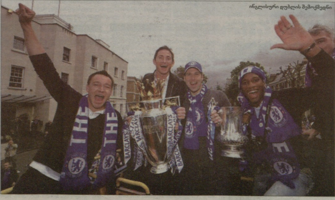
ინგლისური ფეხბურთის შიშობა

კარლი ანგლოფობია... (ლორის ლაზარევიჩის განცხადება...)