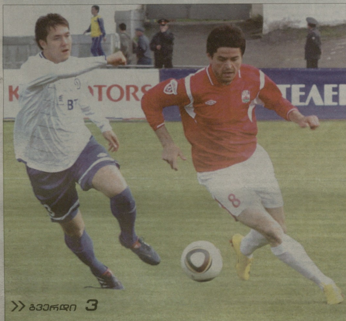
» გვერდი 3