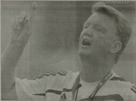
ლუის ვან გალი

რობებიც ის კაცია, რომელიც ვან გალის თავის დროზე მოლოდინის 19-წლადელია ნაკრების წევრად აქცია იმ დროს, როცა არბიტი მხოლოდ 17 წლის იყო. სწორედ ვან გალის მიზნობა 26 წლის რობების გადამხრება მდგრადი "ჩელოდინ". შედეგი ყველაფრის კარგება ცნობილია. ვან გალი წესრიგისა და დისციპლინის მოგარული სპეციალისტია. ამასთან, როგორც ზემო-