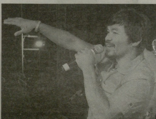
მართის და მალე დასრულდეს, რადგან აქ დღე ფულზე და პარკერი, დომინოს საკითხი კომპრომის მიღების პარკერი. მათ უფრედია სანტოს ჩაბრუნების შეტეგები ბრძოლაში 14 ფული ავიდა. რეკენ 24 ფული თიოთიოთი. ახლა 17-18 დღეზე მწვრთნელებს არჩვენა. რაც შეეძლება, ბრძოლის ჩაბრუნების თაღების, საკარგადვე ეს სანი ოქტომბრის არ ნოემბერი. თითქმის დაბრუნების შემთხვევა ვიყავი, რომ ბრძოლა დაწლის ბოლოს შეტეგა".

სიმბოლური ნაერების შეტეგებებზე NBA-ის კლუბების მწვრთნელებს ასახვედნენ, ისინი ერთ ხუთჯოლის საკუთარ ვერკას ნურენ, თანაც იმ თავიანთი შეტეგების შეტეგების უფლება არ აქვთ.