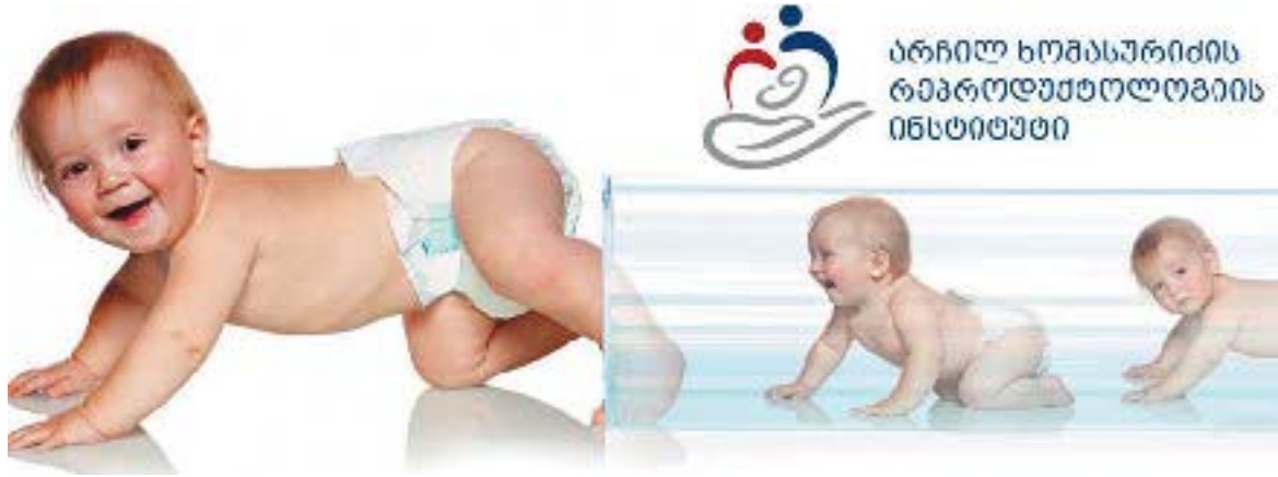
არჩილ ხომასურიძის რეპროდუქტოლოგიის ინსტიტუტი

ვინი რეპროდუქტოლოგიის, რომელიც მე დავაარსე საქართველოში, ანუ უშვილობის მკურნალობას, ქალთა კონტრაცეპცია, სქესობრივ მოშლილობებს, იმპლანტაციას, კლიმაქსს და ა. შ.