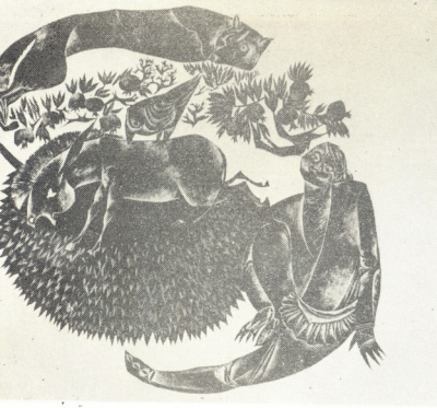
ილუსტრაცია სულხან-საბას იბაჰისათვის