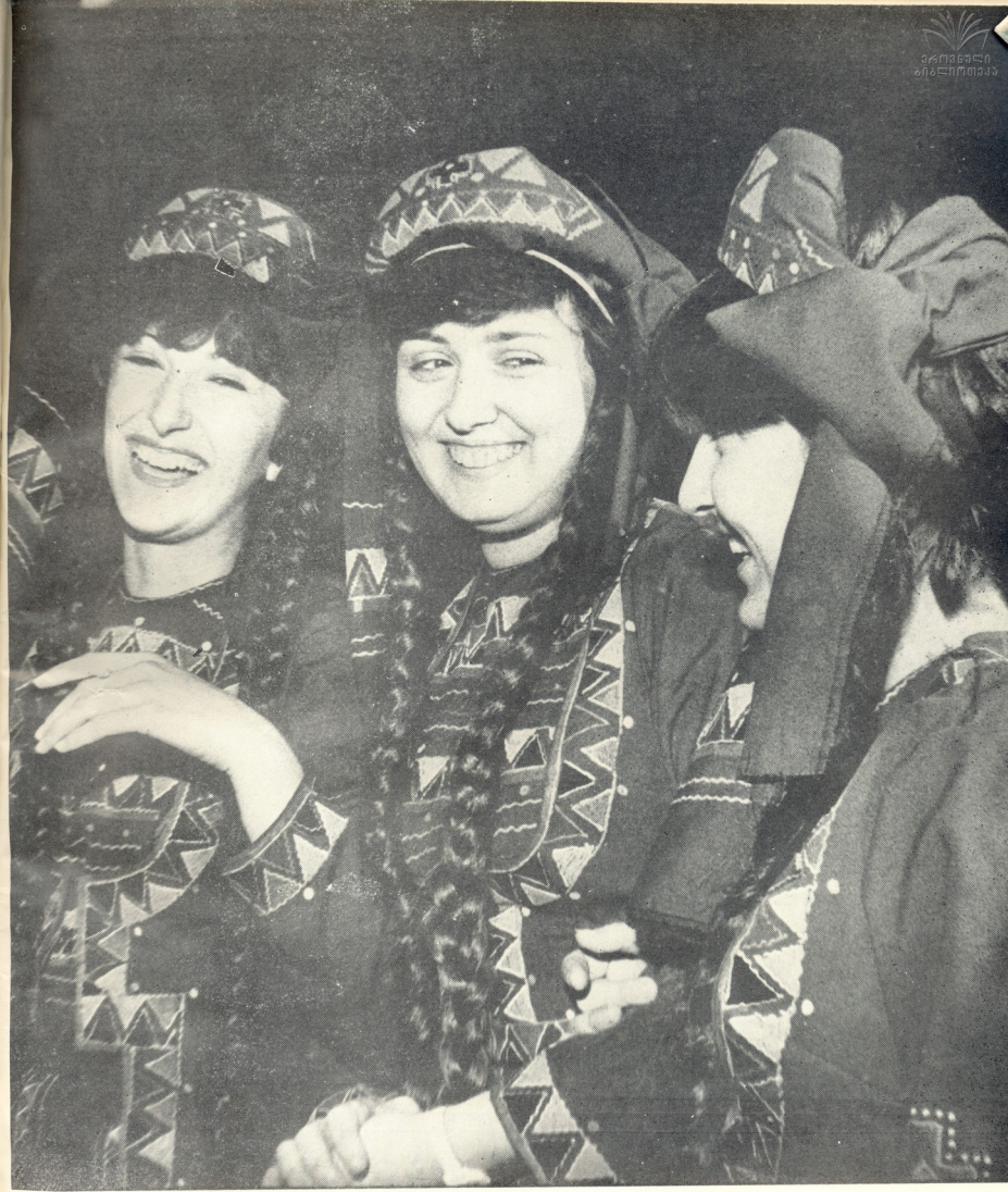
კალაუ შინგა მანდილა...