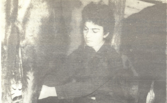
მწველავი ლუბა წყალური

ხელობენ აქაური მოსწავლეები ამა წინა შემთხვევით მეტრეჯისკოლი გოგონს წაკითხული წიგნები მოგვხვდა თვალში: რუსული ლიტერატურის კლასიკოსები — დეტოლსტოი, ანტონ ჩეხოვი, მაქსიმ გორკი, აღდესანდრე ბლოკი... გოგონს ეტყობა შეეყარებია და სულმოუთქმელად წაუკითხავს მათი ნაწარმოებები, დროზე ადრე ჩაუხარებია წიგნები... ქართული მწერლობის დიდი სიყვარული იგრძნობა თითქმის ეველა მოსწავლის კლასგარეშე საკითხავი ლიტერატურის სიების გაცნობისას... ადამი წიგნის ესოდენი „გადმრთობაა“, მათ რომ იფარავს დანაშაულისაგან.