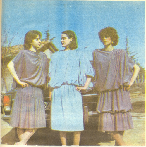
საქართველოს სსრ საეროფაბრიკებო მომსახურების სამინისტროს მოდელების სახლში