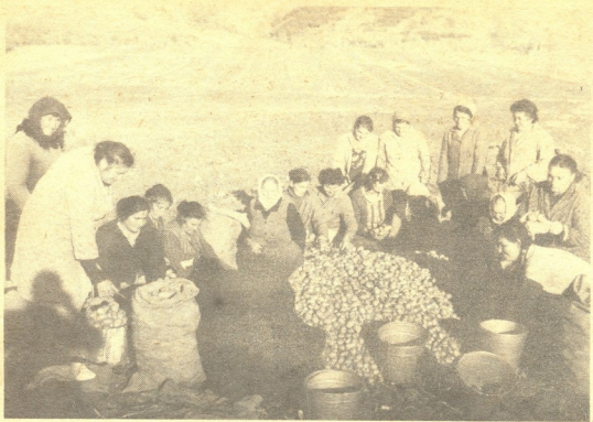
განთიადის საბჭოთა მურენების შემინდვრები