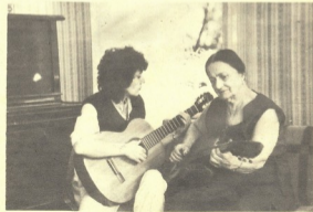
Երկու երեխա էլ իրենց ներկայումս: Բ. Գրիգորյան

Ցանցի կազմավորման համար նախնին ավելի մեծ նշանակություն տալով, նախնին ավելի մեծ նշանակություն տալով, նախնին ավելի մեծ նշանակություն տալով: