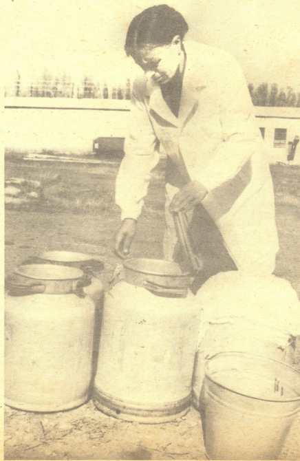
ბაშკირეთის საბჭოთა მურენების უგანრიკო რგოლის ზელსაუნკელი ხალი ანკელაჯა

კოლექტიური იჯარა ასრულებს მახების ორგანიზატორის, ისე აღმარდელ როლს და მშრომლებს მხოლოდ ერთი მიზნისათვის აერთიანებს. რგოლში დიდმა მომზოგუნელობამ შექნაზატორი ა. ანროვი აიძულა კოლექტივიდან წასულიყო. უგანრიკო რგოლი მართო სამეურნეო შედეგებით როლი შემოიფარგლება. მისი ახალგაზრდა წევრები ეკონომიკური სწავლებას სკოლაში გაერთიანდნენ. მათ საბჭოთა მურენების პარტიული კომიტეტისა და დირექციის წინაშე დასვეს სამეშრომლებლო ინციკლინის განმტყების საკითხი.