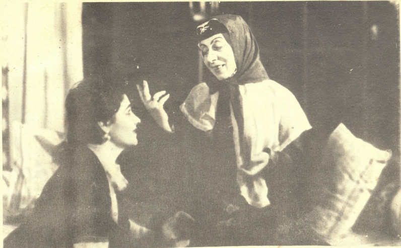
„ხანუმა“ — ხანუმა