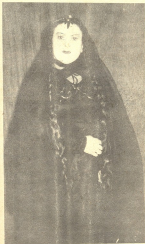
ა. წერეთელი. „პატარა კახი“ — დიდოფალი.

(„მიბია თომაძე ქიხი“), პეპელა („პარაკუნე“), ლლი მლფორდი („ვერაობა და სივარული“), კატო („ქაჯანი“), ჯავარა („მოკვეთილი“), ოლა ჰავევაძე („წინაშური“), ნინო გურიელი („დაპოლი არწივი“), დარო („ვახის ტირილი“), შარია („ვახისუნელი მშაკევი“).