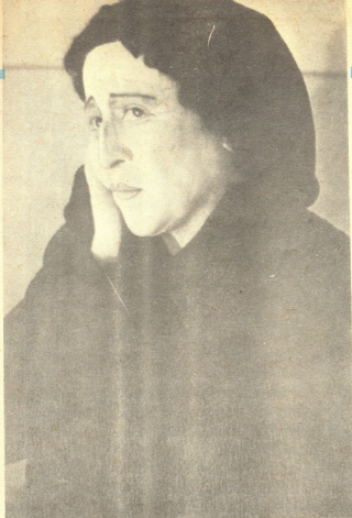
ბ. ბერიაშვილი. „გული ხელის გულზე“ — თაფლო ბაბო