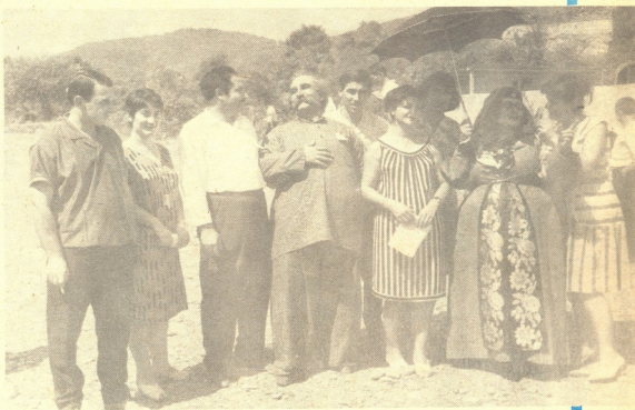
ი. ჰავევაძე. „იკვია ადამიანი“ — ლარეკანი — მ. ლაღაშვილი გრემ-ქალაქობაზე