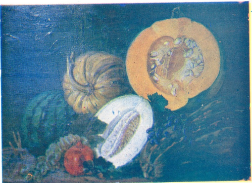
მარიამ კვლავტრიშვილის ფერწერული ნაშუუერები